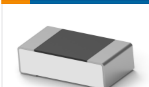
TE 产品编号9-2176371-5 RQ 0603 44K2 0.1% 10PPM 5K RL