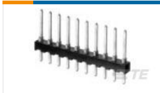
TE 产品编号87224-1 01 MODII HDR SRST UNSHRD .100