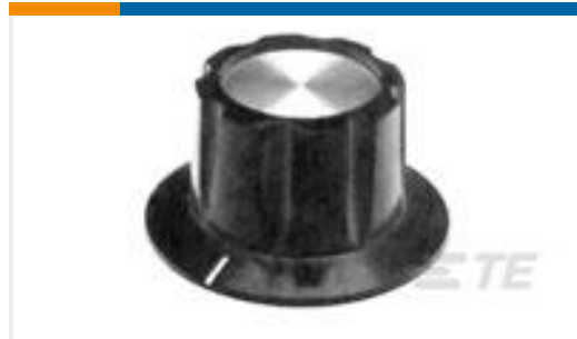
TE 产品编号2-1437624-4 PKB90B1/4=KNOB PLASTIC W/SKIRT