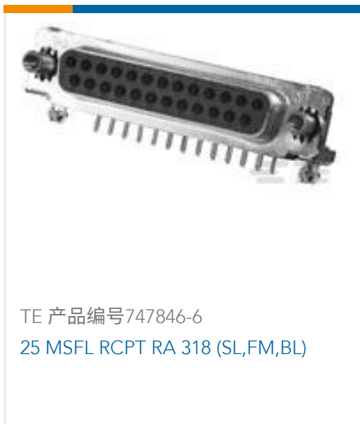
TE 产品编号747846-6 25 MSFL RCPT RA 318 (SL,FM,BL)