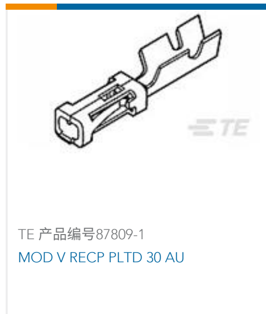
TE 产品编号87809-1 MOD V RECP PLTD 30 AU