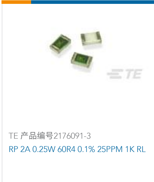
TE 产品编号2176091-3 RP 2A 0.25W 60R4 0.1% 25PPM 1K RL