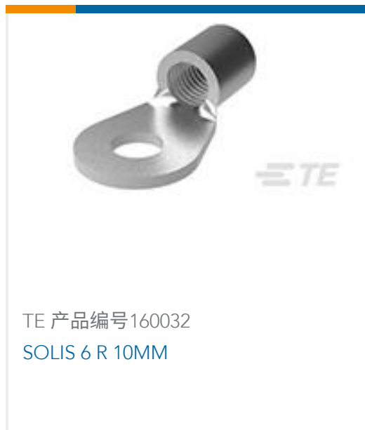
TE 产品编号160032 SOLIS 6 R 10MM