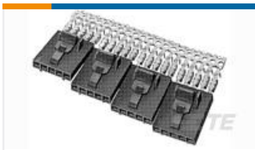
TE 产品编号1-103958-2 10X2 MTE RPT SR LATCH .100CL