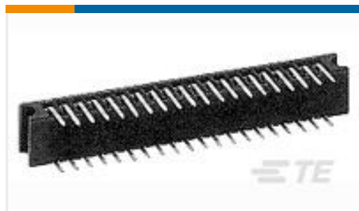
TE 产品编号1-532956-2 80 MODII 2PC CE RCPT ASSY