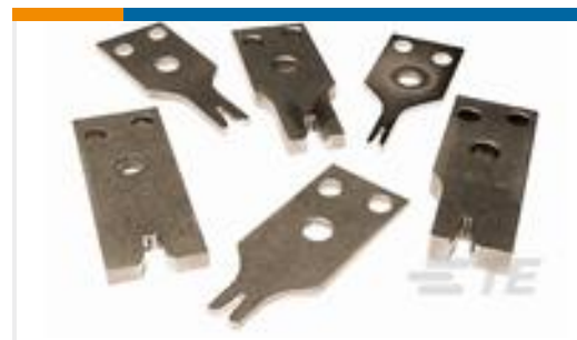
TE 产品编号4-456135-9 CRIMPER, INSULATION "O"(.180")