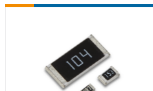
TE 产品编号5-2176337-3 CRGCQ 0402 220K 1%