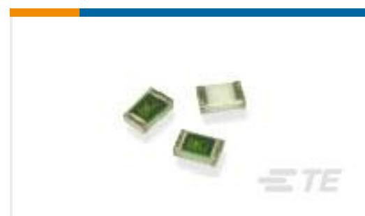
TE 产品编号1676143-2 RN 0805 100R 0.1% 10PPM 1KRL