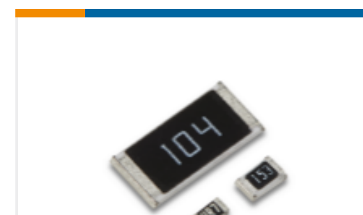
TE 产品编号2-2176337-9 CRGCQ 0402 2K2 1%