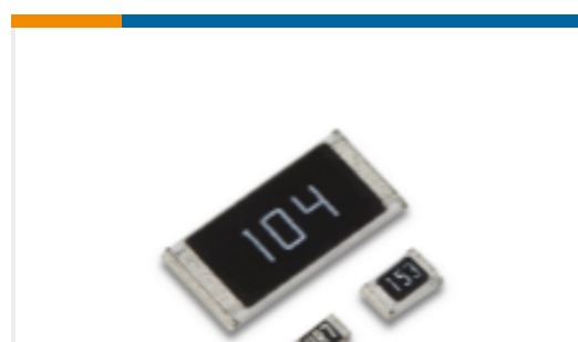
TE 产品编号1-2176337-3 CRGCQ 0402 100R 1%