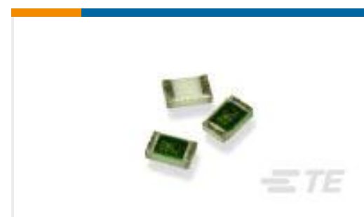
TE 产品编号9-1676481-6 CPF 0603 82K 0.1% 25PPM 1K RL