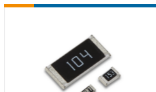
TE 产品编号6-2176337-1 CRGCQ 0402 1M0 1%