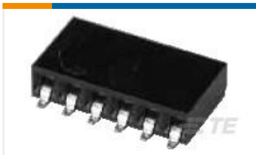
TE 产品编号5147733-3 04 MODII HORZ SR SFMNT SN