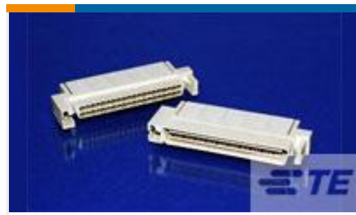
TE 产品编号6367580-3 ASSY Z-DOK+4 HOST BOARD 24PR