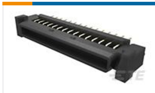
TE 产品编号5176374-2 AMP FH CONN REC V 60P (H=14)