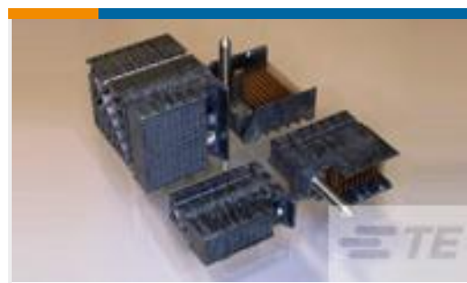
TE 产品编号2149977-2 IMP100S,H,V4P6C,UG,REW39,4,9