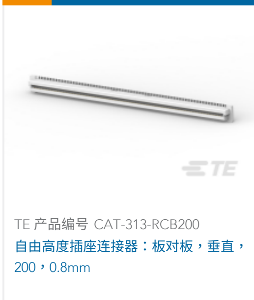
TE 产品编号 CAT-313-RCB200 自由高度插座连接器：板对板，垂直，200，0.8mm