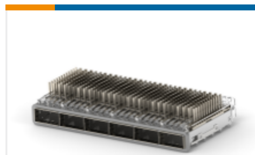
TE 产品编号2170207-4 1X6 QSFP ASSEMBLY THRU BZL W/4 PORT LP