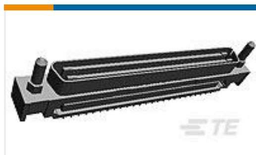
TE 产品编号5787886-1 200 50SR CMP LP VERT PLUG,DOCK