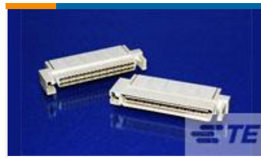
TE 产品编号6367583-1 ASSY Z-DOK+4 ADAPTER BRD 24PR