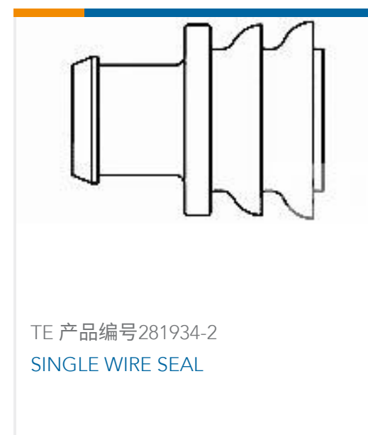
TE 产品编号281934-2 SINGLE WIRE SEAL