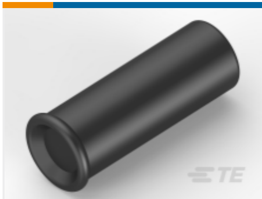
TE 产品编号 1-5050871-9 SOCKET,MIN-SPR W/H SN-AU SER-5