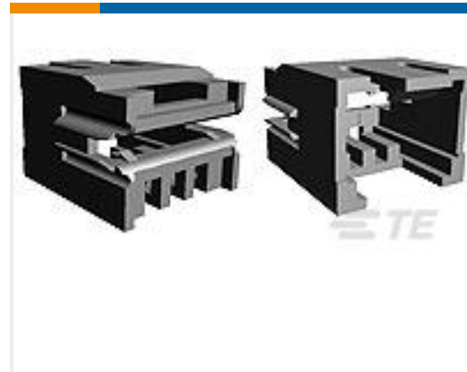
TE 产品编号1-964575-5 PCB RAHMEN 5P