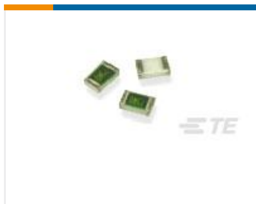
TE 产品编号3-1879134-1 RN 0603 20K5 0.1% 10PPM 1K RL