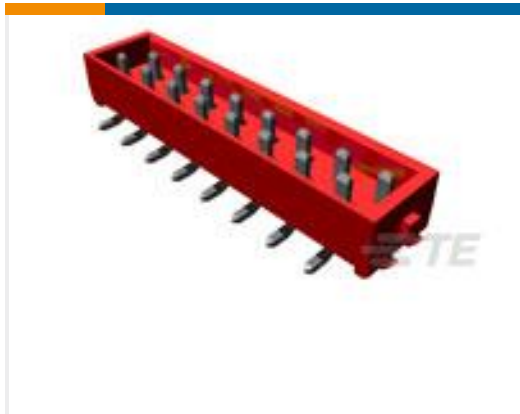
TE 产品编号8-338728-4 MICROM. MOB SMD CON