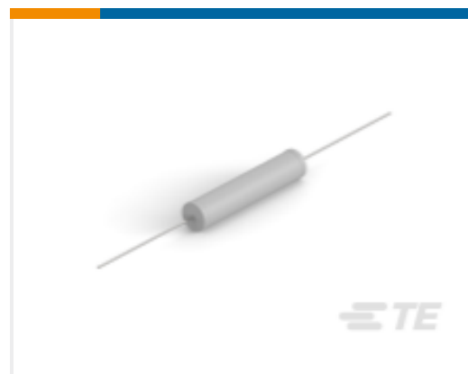
TE 产品编号4-2176415-8 8W STD M/OX 5% 2K7