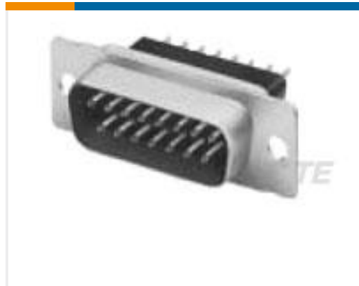
TE 产品编号205714-7 37 PLUG SP/MS STD