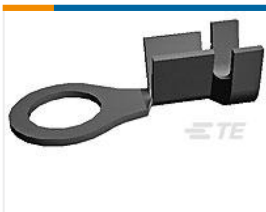
TE 产品编号109452-4 RING TONGUE 170 18-14 AWG PTPBR