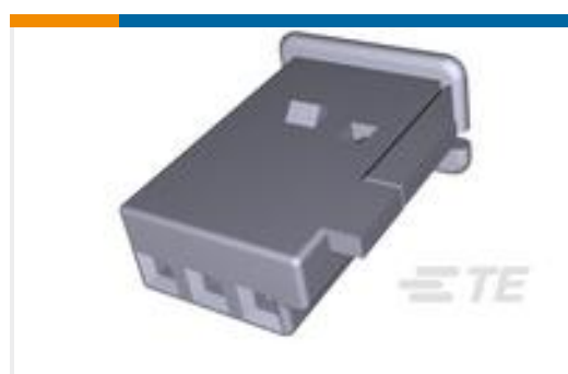
TE 零件编号969778-2 FFC GEH ASSY 3P