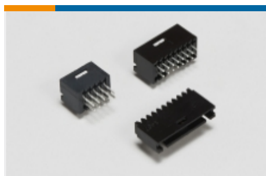
多配置 PCB 接头和插座(5)