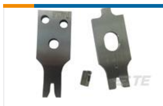
TE 零件编号7-2151678-7 OCEAN_2. 0_SPARE_PART_KIT- 042F0500