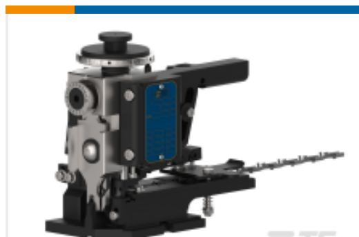
TE 零件编号2150529-1 OCEAN_2.0_APPLICATOR- E-091F130F