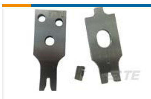
TE 零件编号7-2266278-7 OC-042F0500- CRIMPTOOLINGKIT