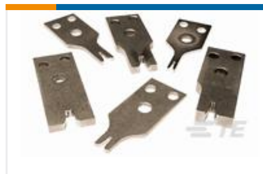
TE 零件编号4-459736-2 WIRE, CRIMPER