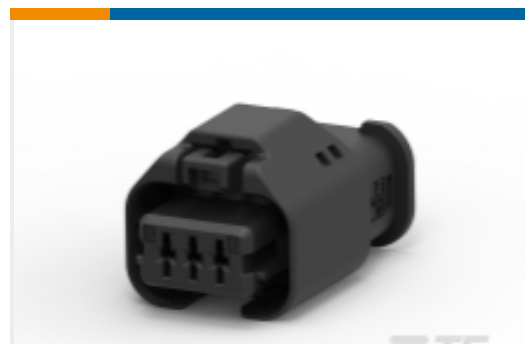
TE 零件编号1801178-9 3W RECEPTACLE HP CONNECTOR ORANGE