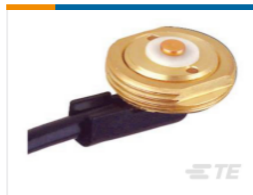
TE 产品编号MBO-L MOUNT,BMM,3/4 STD,NO CBL/CON