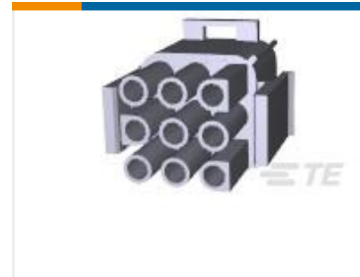
TE 产品编号1-480706-9 09P UMNL PLUG HSG BLK