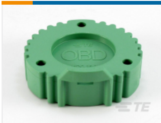
TE 产品编号2301692-1 DUST CAP, 9P, REC, GRN, J1939, HD10