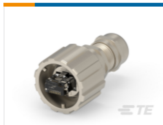
TE 产品编号2362760-1 IDC PLUG, Die Cast