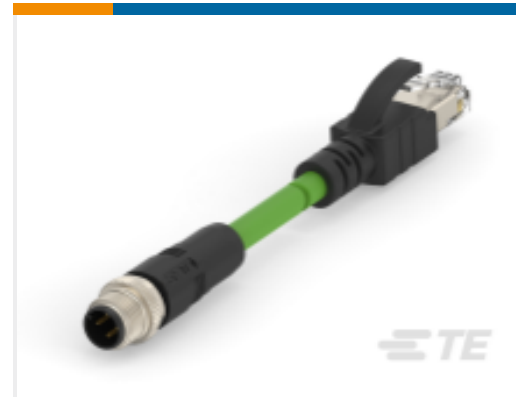
TE 产品编号TCD14745101-003 M12 D-code 4pin Male to RJ45 Cable Assembly, Cat5e Polyurethane 24AWG Shielded