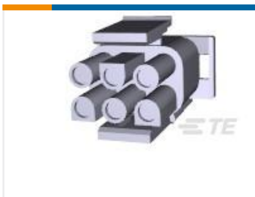
TE 产品编号1-480704-4 06P UMNL PLUG HSG YELL