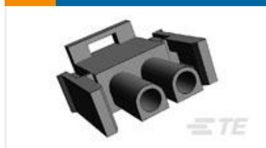
TE 产品编号1-480698-9 02P UMNL PLUG HSG BLK