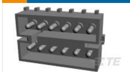
TE 产品编号350220-1 12P CMNL HDR ASSY PC NATL