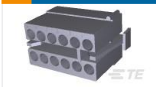
TE 产品编号1-480287-0 12P CMNL PLUG HSG M/M NATL