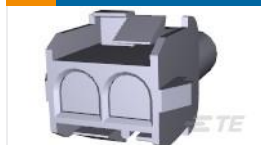
TE 产品编号1-480699-9 02P UMNL CAP HSG BLK