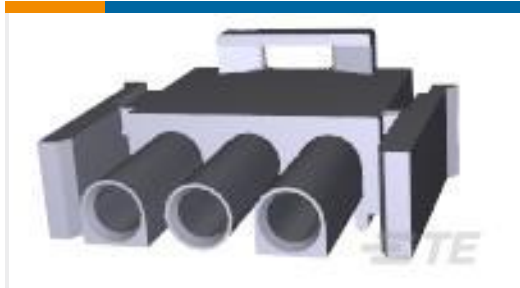
TE 产品编号1-480700-9 03P UMNL PLUG HSG BLK