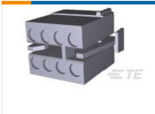
TE 产品编号1-480283-0 08P CMNL PLUG HSG M/M NATL