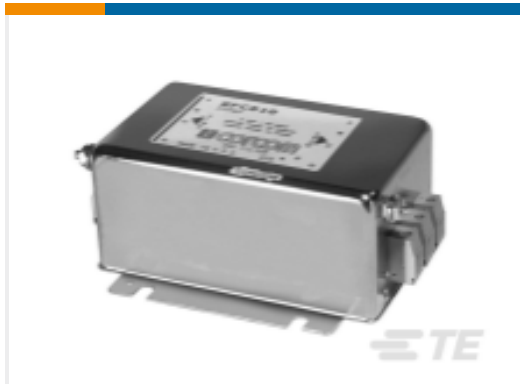
TE 产品编号6609070-6 3 Phase Filters, Corcom FCD Series