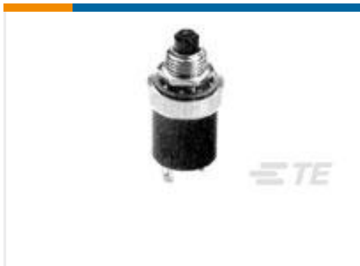
TE 产品编号1825516-2 MSP103C04