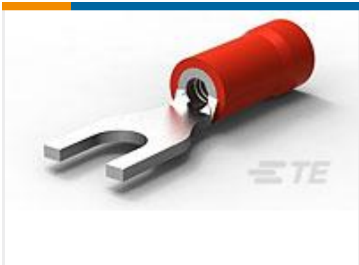
TE 产品编号327043 PG SPD 22-16 COMM 22-18 MIL 6