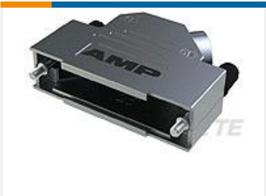
TE 产品编号5-1478763-2 Metal backshell 15 way 45 Deg Entry-KIT