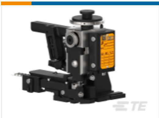
TE 产品编号2151752-1 OCEAN_2.0_Applicator-S-083F089O-RSM