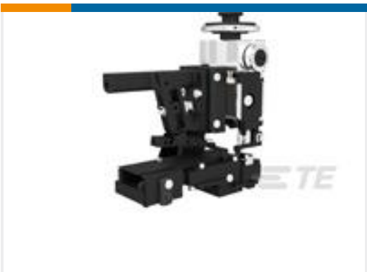
TE 产品编号2266001-1 OCEAN_2.0_APPLICATION-S-083F089F-RSM