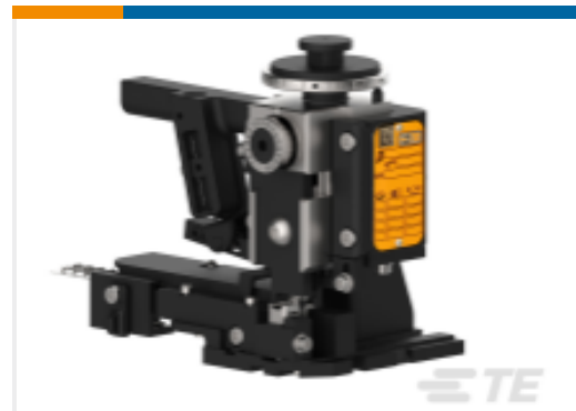
TE 产品编号2266270-1 OCEAN_2.0_Applicator-S-110F160F-RSM