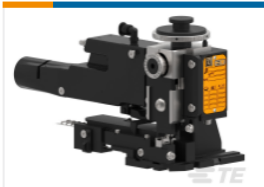
TE 产品编号2266273-2 OCEAN_2.0_APPLICATOR-S-110F190F-RSA