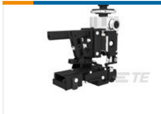
TE 产品编号2151080-1 OCEAN_2.0_APPLICATOR-S-062F110F-RSM