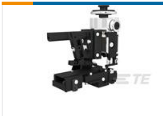
TE 产品编号2151240-1 OCEAN_2.0_APPLICATOR-S-055F075F-RSM