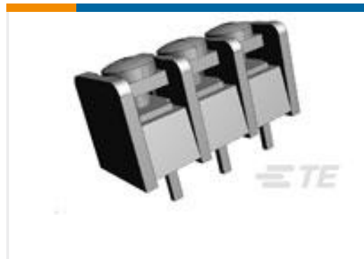
TE 产品编号2-1437667-5 4DB-P108-03=4DB ASSEMBLY