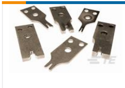
TE 产品编号2-456401-1 CRIMPER, WIRE .042F