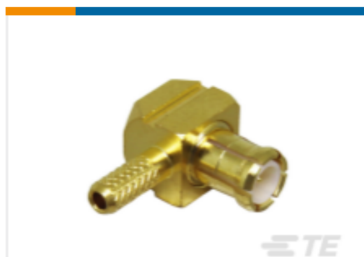
TE 产品编号CONMCX012-R178 MCX Plug 50 Ohm Cable Crimp