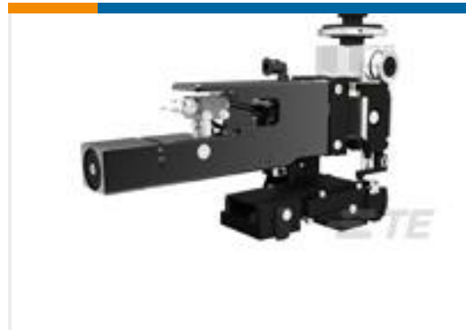
TE 产品编号2151086-2 OCEAN_2.0_APPLICATOR-S-160F240F-RSA