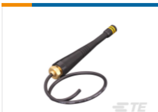
TE 产品编号ANT-916-PW-QW Antenna 1/4 Wave Whip 916MHz RG174