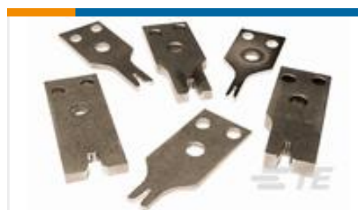
TE 产品编号1633962-3 CRIMPER, INSULATION F PREMIUM