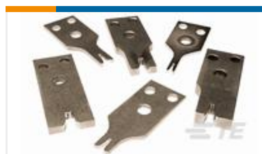
TE 产品编号3-456406-3 CRIMPER, WIRE .090 "F"