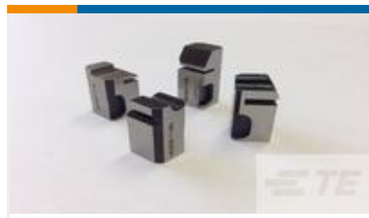
TE 产品编号1803141-1 FLOATING SHEAR, FRONT