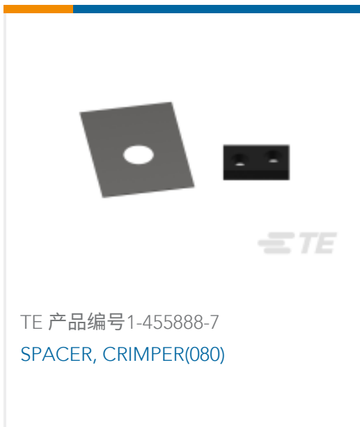
TE 产品编号1-455888-7 SPACER, CRIMPER(080)