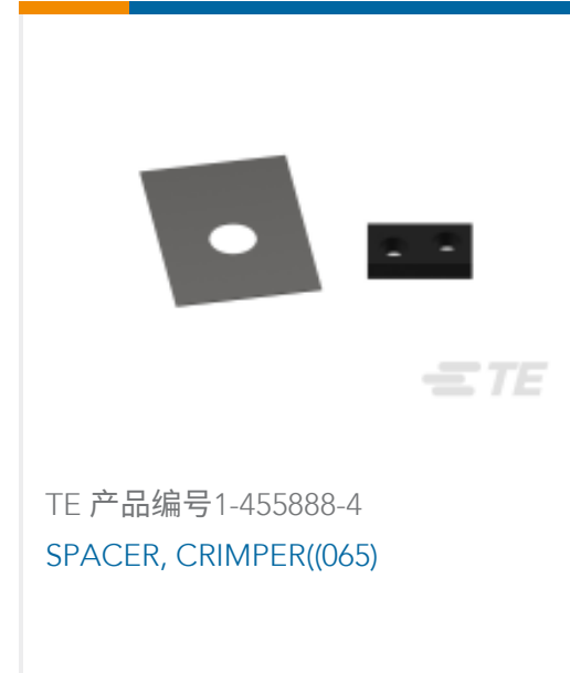
TE 产品编号1-455888-4 SPACER, CRIMPER((065)