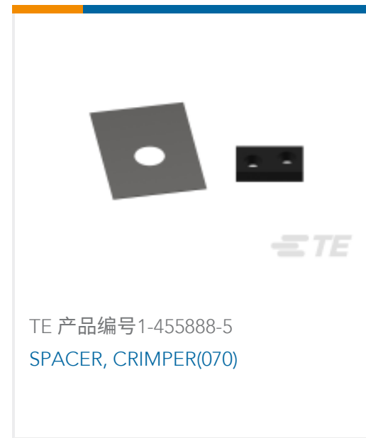
TE 产品编号1-455888-5 SPACER, CRIMPER(070)