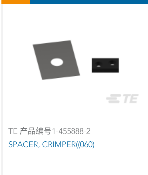
TE 产品编号1-455888-2 SPACER, CRIMPER((060)