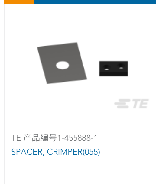
TE 产品编号1-455888-1 SPACER, CRIMPER(055)