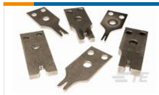
TE 产品编号2-1333281-7 CRIMPER, WIRE, F PREMIUM (.042")