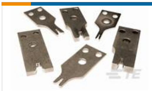
TE 产品编号1-456402-7 CRIMPER WIRE .055 F