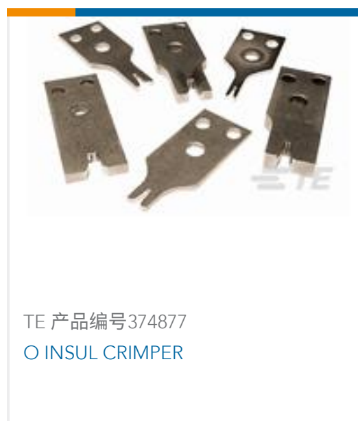
TE 产品编号374877 O INSUL CRIMPER