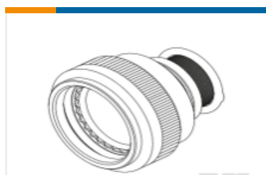
TE 产品编号110657-000 TXR54AB00-3214AI