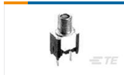
TE 产品编号1-1825098-7 TPCF11CGPC004