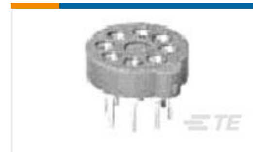
TE 产品编号4-1437508-4 8059-2G3=TO5 PC SOCKET 200 GOL