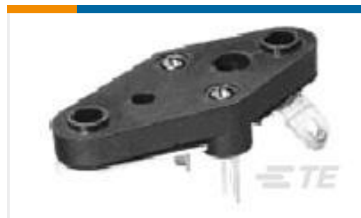
TE 产品编号4-1437504-2 8080-1G3=TRANSISTOR SOCKET ASS