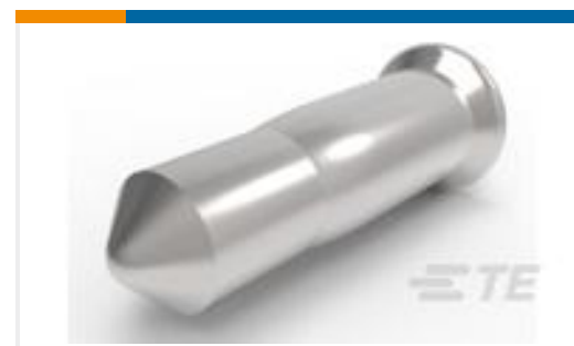
TE 产品编号645952-2 SOCKET,MIN-SPR B-N SN-AU SER-2