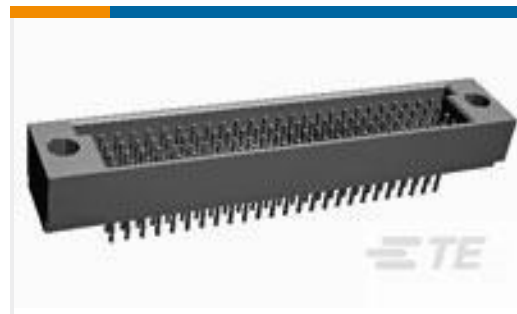
TE 产品编号532448-9 HDI PIN ASSY 4 ROW 240 POS