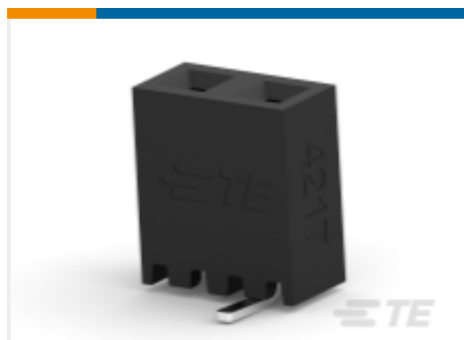
TE 产品编号2307813-2 2P,2MM,B-B,REC,SR,DE,SMD,0.1AU