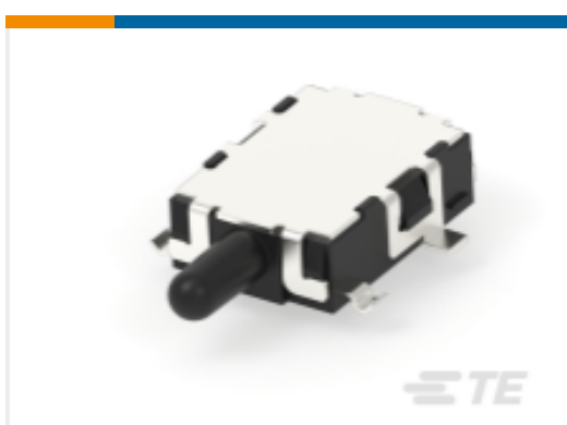
TE 产品编号2331390-1 DET SW5.7X4.0X2.0 GW HORZ. NC AG RL