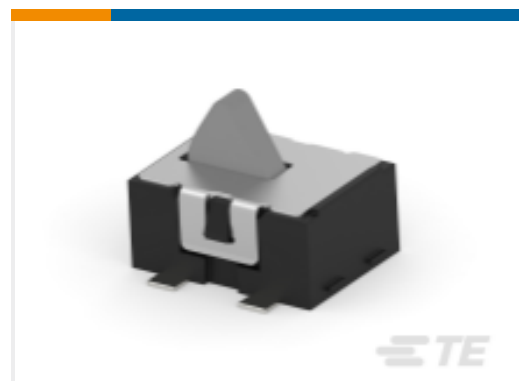
TE 产品编号2331417-1 DET SW4.7X3.5X2.2 GW VERT. NO AG RL