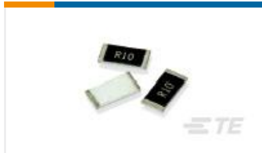
TE 产品编号4-1879463-7 RL73H 2E R82 1% 1K RL