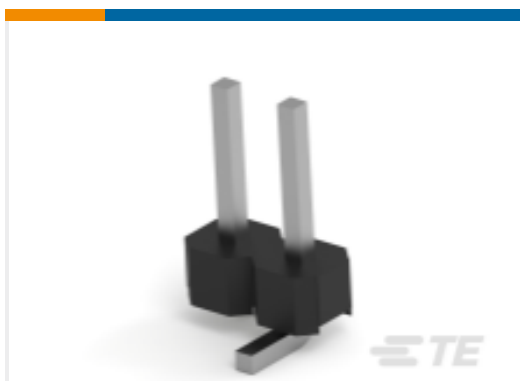
TE 产品编号2842102-2 2P,2MM,BRK HDR,SRVT,SMD,0.1AU, TR W/CAP