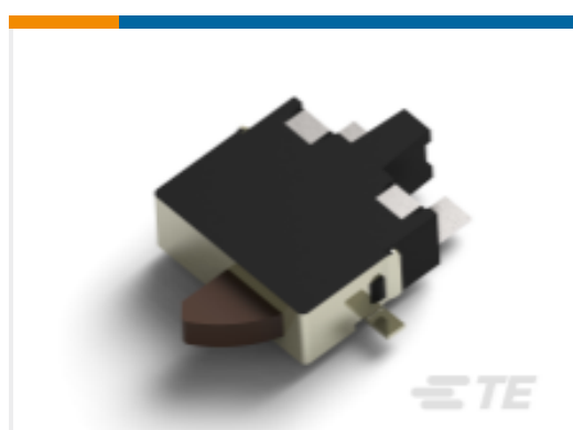
TE 产品编号2331401-1 DET SW6.0X4.85X2.0 GW HORZ.(L) NO AG RL