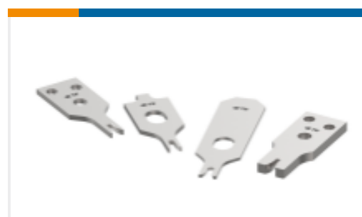
CRIMPER REPRESENTATION ONLY