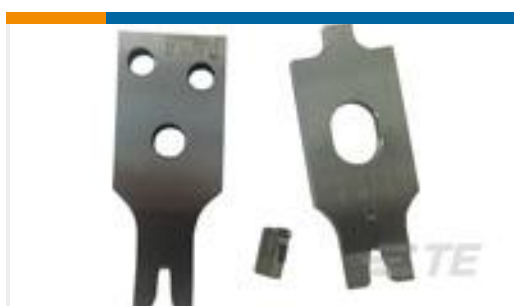
TE 产品编号7-2151773-7 OCEAN_2.0_SPARE_PART_KIT-081F1100