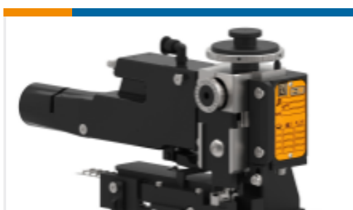
TE 产品编号2266673-2 OCEAN_2.0_APPLICATOR-S-044F062O-RSA