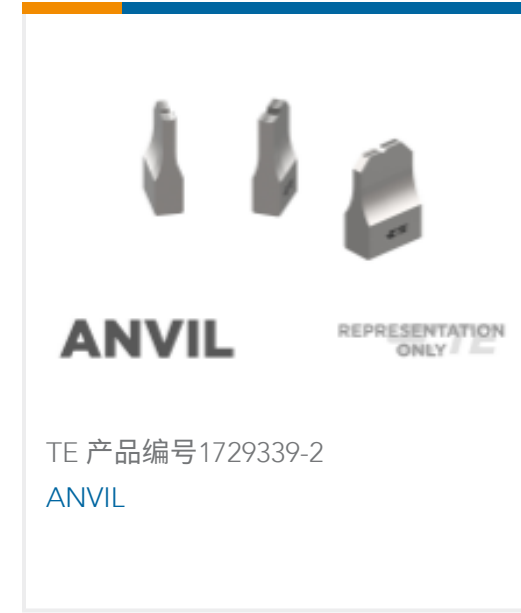
TE 产品编号1729339-2 ANVIL