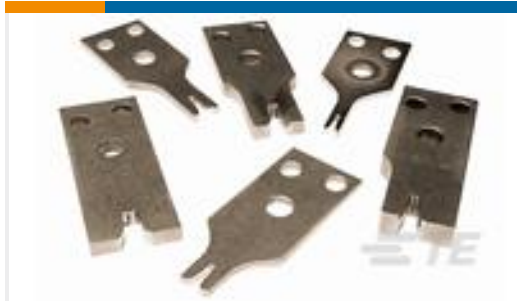
TE 产品编号1729698-6 CRIMPER,WIRE