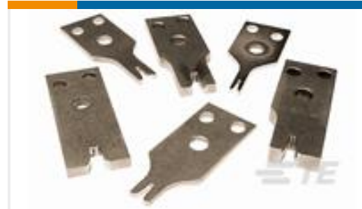
TE 产品编号913274-4 INSULATION, CRIMPER