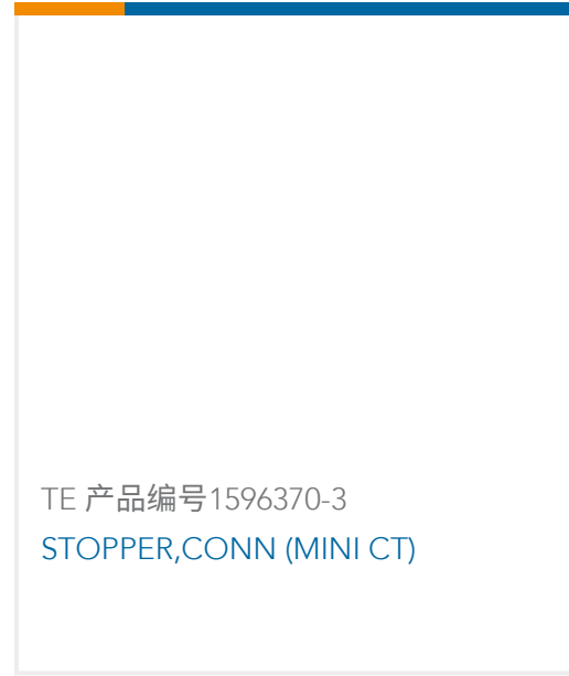
TE 产品编号1596370-3 STOPPER,CONN (MINI CT)