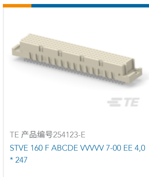
TE 产品编号254123-E STVE 160 F ABCDE VVVV 7-00 EE 4,0 * 247