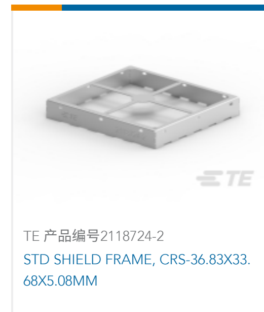
TE 产品编号2118724-2 STD SHIELD FRAME, CRS-36.83X33. 68X5.08MM