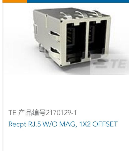
TE 产品编号2170129-1 Recept RJ.5 W/O MAG, 1X2 OFFSET