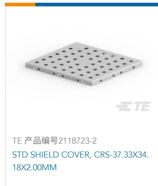
TE 产品编号2118723-2 STD SHIELD COVER, CRS-37.33X34. 18X2.00MM