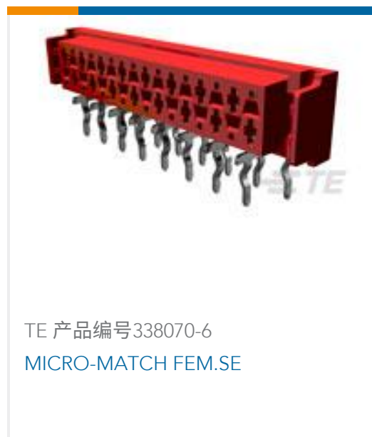
TE 产品编号338070-6 MICRO-MATCH FEM.SE