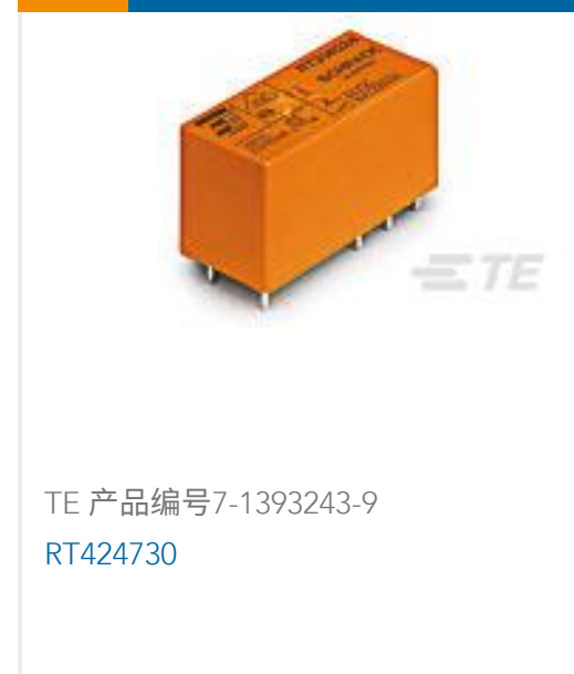
TE 产品编号7-1393243-9 RT424730