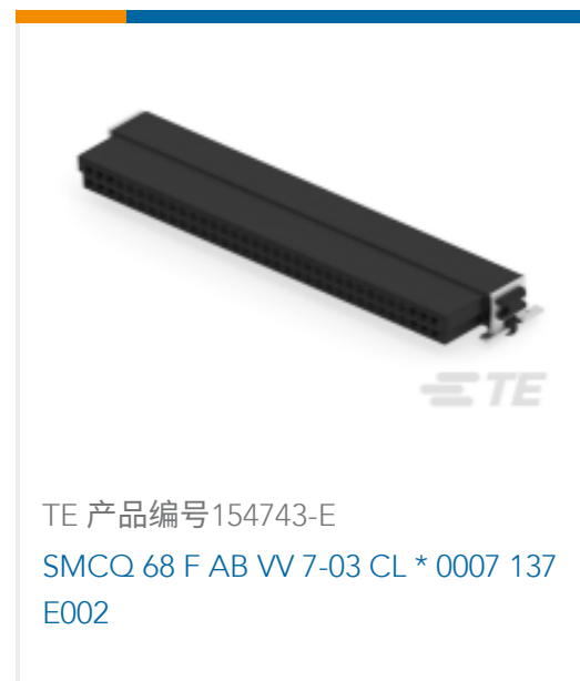
TE 产品编号154743-E SMCQ 68 F AB VV 7-03 CL * 0007 137 E002