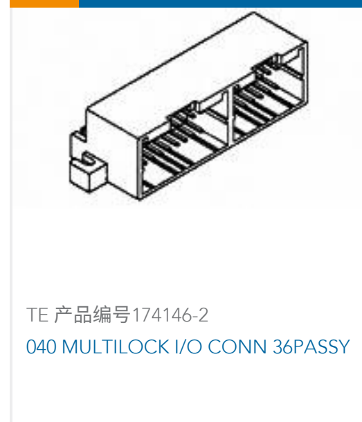
TE 产品编号174146-2 040 MULTILOCK I/O CONN 36PASSY