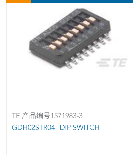
TE 产品编号1571983-3 GDH02STR04=DIP SWITCH