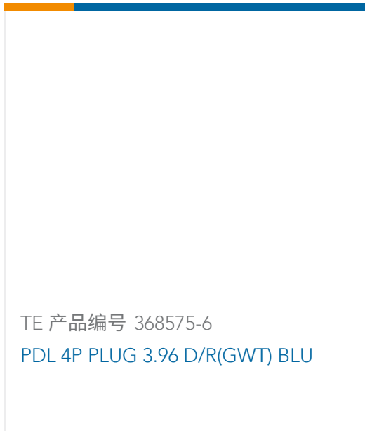
TE 产品编号 368575-6 PDL 4P PLUG 3.96 D/R(GWT) BLU