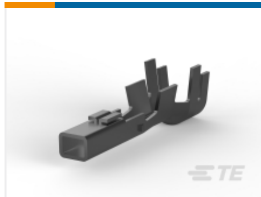
TE 产品编号 CAT-P87024-R2435 电源双重锁定母端