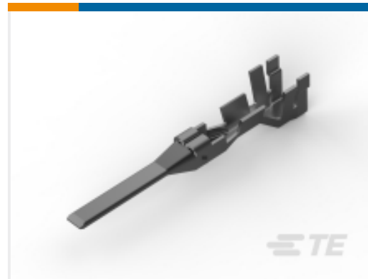
TE 产品编号 CAT-P87024-T111 电源双重锁定公端