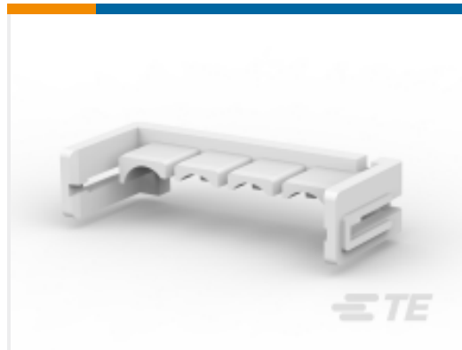
TE 产品编号 177920-1 POWER DBL LOCK PLATE 3.96MM 4POS