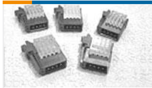
TE 产品编号4-1473562-3 RITS CONN. PLUG ASSY 3P GREEN