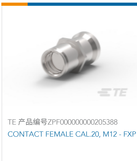
TE 产品编号ZPF000000000205388 CONTACT FEMALE CAL.20, M12 - FXP