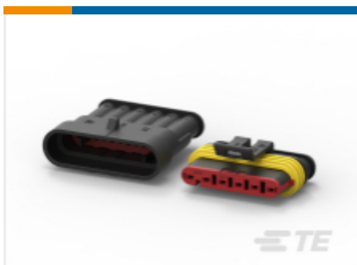
TE 产品编号282104-1 AMP SUPERSEAL 1.5MM, 连接器壳体