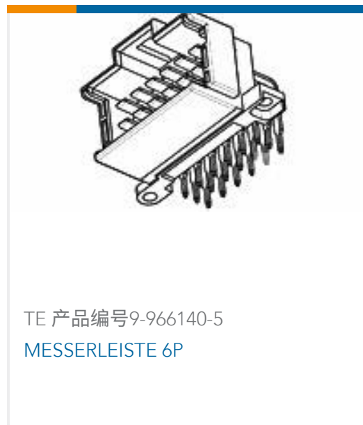
TE 产品编号9-966140-5 MESSERLEISTE 6P