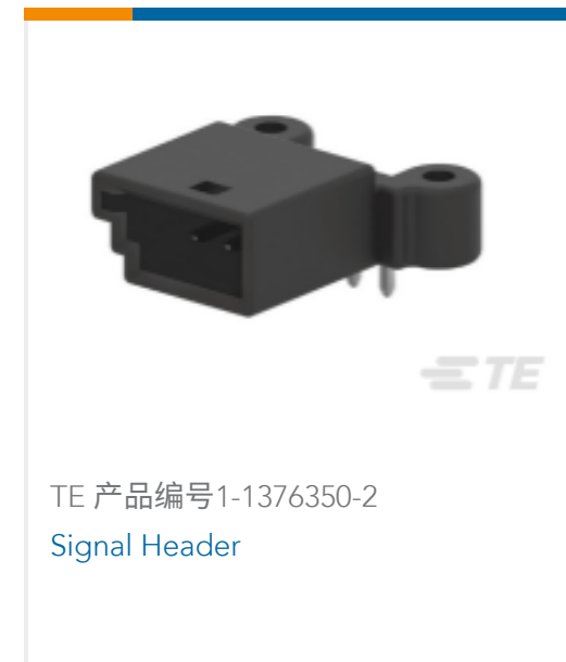
TE 产品编号1-1376350-2 Signal Header