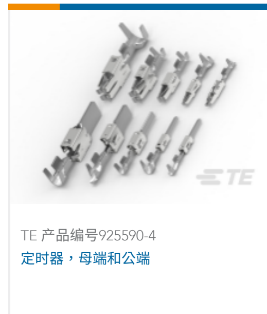
TE 产品编号925590-4 定时器, 母端和公端