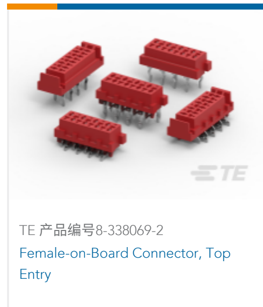
TE 产品编号8-338069-2 Female-on-Board Connector, Top Entry