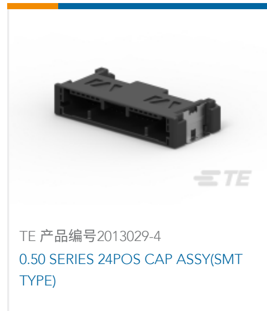
TE 产品编号2013029-4 0.50 SERIES 24POS CAP ASSY(SMT TYPE)