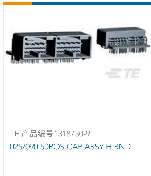
TE 产品编号1318750-9 025/090 50POS CAP ASSY H RND