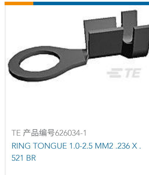
TE 产品编号626034-1 RING TONGUE 1.0-2.5 MM2 .236 X .521 BR