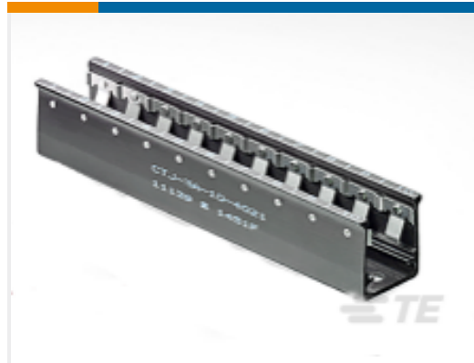
TE 产品编号CTJ-3D-10 RAIL ASSY