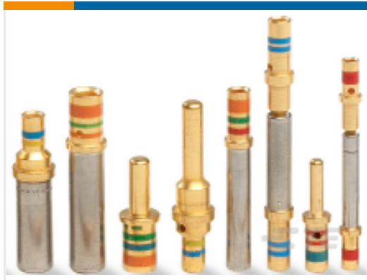
TE 产品编号0660-206-1282 CONT PIN