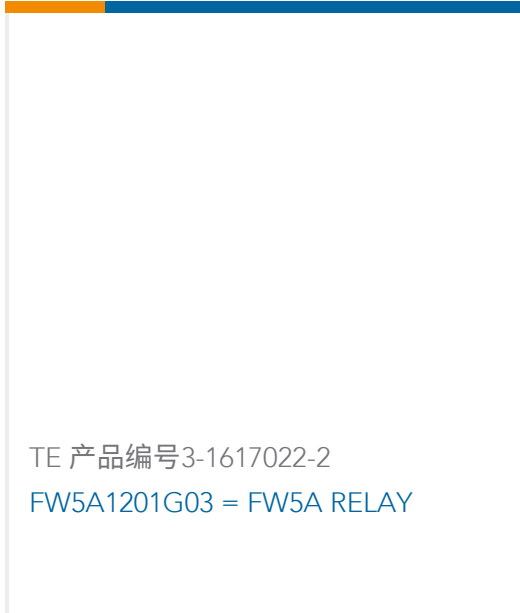
TE 产品编号3-1617022-2 FW5A1201G03 = FW5A RELAY