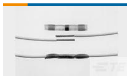
TE 产品编号D33598-000 B-152-9003