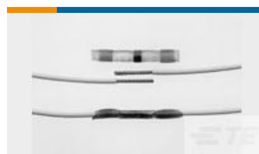
TE 产品编号F80600-000 B-152-9004