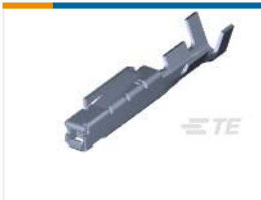
TE 产品编号1318108-1 DYNAMIC D-2000 REC CONT S L/P