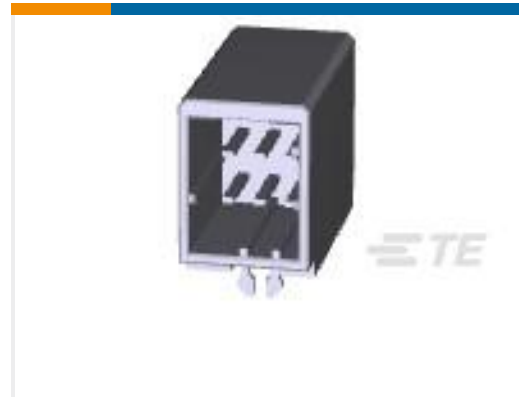
TE 产品编号1376136-1 DYNAMIC D2100 HDR H ASSY 6P X