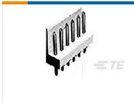
TE 产品编号1-171825-2 POST HDR ASSY VERT AMP EI CONN