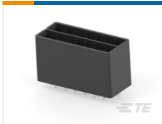
TE 产品编号2-316132-3 Header Assembly: Wire-to-Board, 15A, gold or tin plated