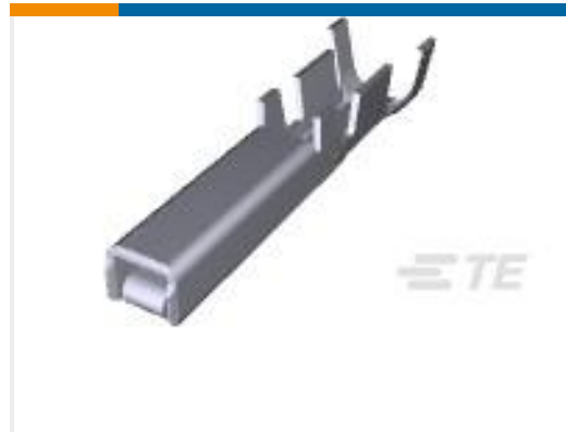
TE 产品编号1-353717-3 DYNAMIC D-3 REC CONT. 3L AU 0.76 L/P