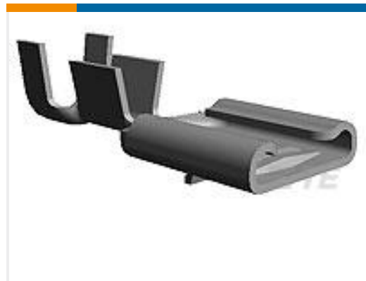
TE 产品编号170108-4 FF 250 REC 18-14AWG TPBR LP