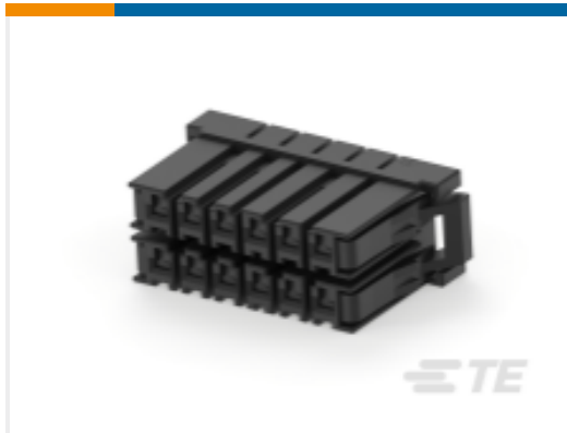
TE 产品编号1-178128-6 Receptacle and Tab Housing: 5.08 mm Pitch, 250-600V