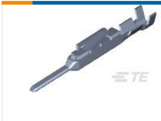
TE 产品编号1318110-1 DYNAMIC D-2000 TAB CONT S