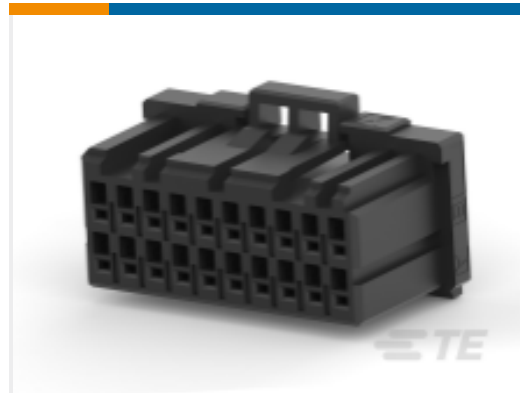
TE 产品编号1-2333149-0 DYNAMIC 1100D REC HSG 20P X BLACK 33% GF