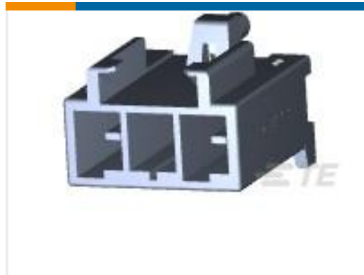
TE 产品编号179844-1 AMP POWER D/LOCK T/HDR ASSY 2P