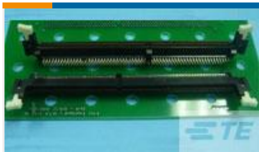
TE 产品编号3-1489841-2 DDR2 240P PB FREE 3.18 15AU HD