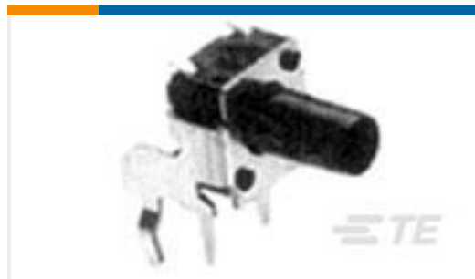
TE 产品编号2-1825027-0 FSMRA7JH04=R/A,TACT PB SW,160G