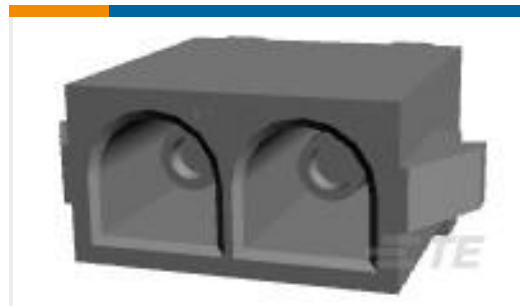
TE 产品编号350824-4 02P UMNL HDR ASSY PC LF