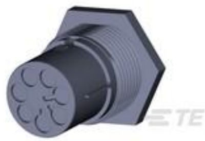
TE 产品编号 293774-3 NECTOR M PIN HSG PANEL MOUNT 7P CODE C