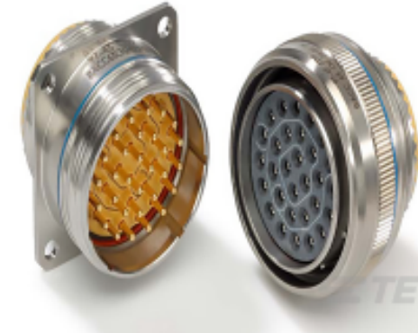
TE 产品编号ZPF0000000000007174 983-ORS 08-98 PN