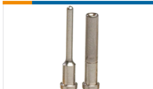
TE 产品编号ZPF000000000001261 097-0267-16 A1267