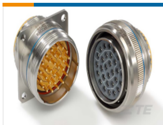
TE 产品编号ZPF0000000000007174 983-0RS 08-98 PN