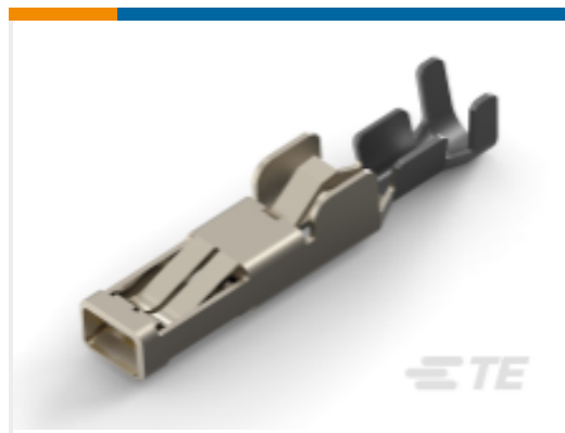
TE 产品编号 179316-4 HYBRID MINI DRAWER REC CONT.#1