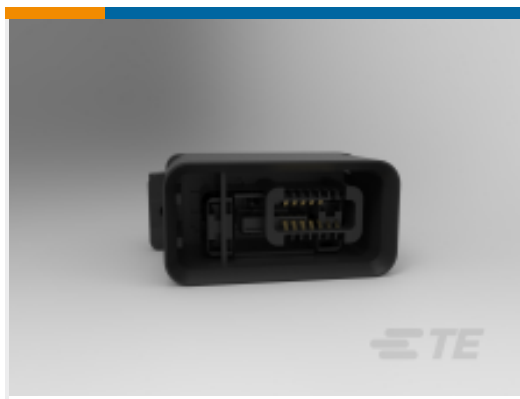
TE 产品编号 1-292241-2 1.5 MINI CT HYBRID SF DRAWER P