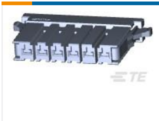
TE 产品编号 1-178128-6 DYNAMIC 3200 REC HSG 6P X