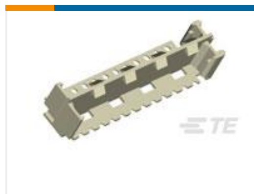
TE 产品编号 3-175133-0 CT DOUBLE ROW 30P HOLDER NATU.