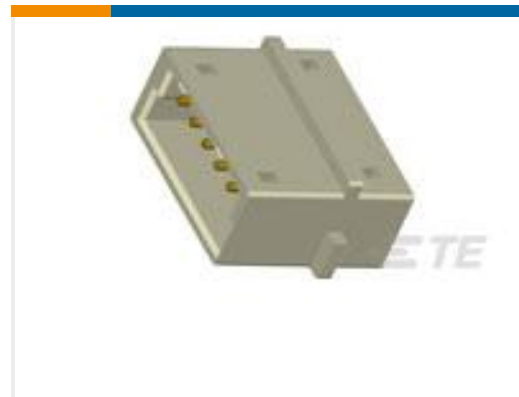
TE 产品编号 4-292156-2 CT RELAY HDR ASSY FREE HANGING