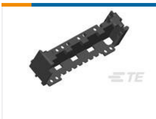
TE 产品编号 2-179472-6 CT DBL ROW HOLDER, CRIMP, 26P, NA