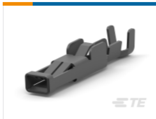
TE 产品编号 1-179316-2 HYBRID MINI DRAWER REC CONT.