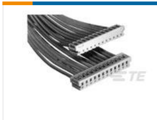
TE 产品编号 179228-2 CT CRIMP TYPE REC HSG