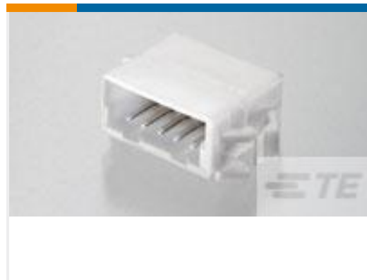
TE 产品编号 2-292254-6 CT RELAY HDR ASSY 6P BLUE