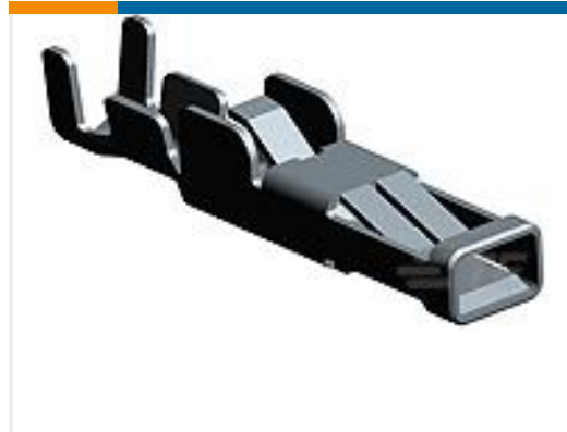
TE 产品编号 179317-2 HYBRID MINI DRAWER REC CONT.