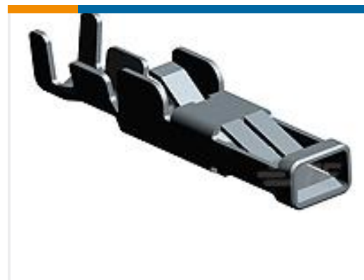
TE 产品编号 1-179317-2 HYBRID MINI DRAWER REC CONT.