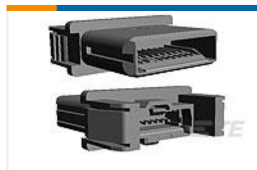
TE 产品编号1-1612256-2 PLUG ASSY 12P ,MINI CT DC DRAW