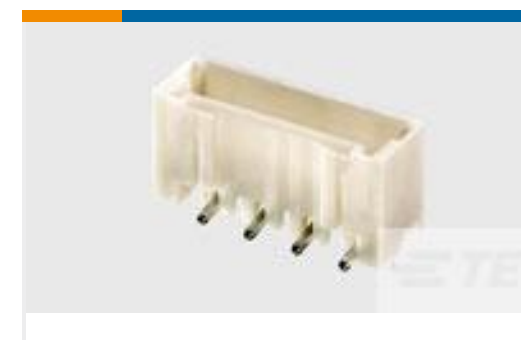
TE 产品编号1-292231-1 1.5 MINI CT SGL V SMT W/O BOSS