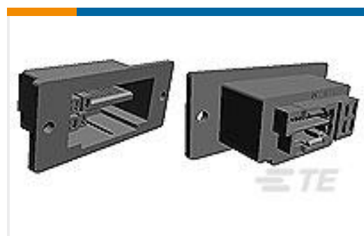
TE 产品编号2-292246-2 1.5 MINI CT LATTICE REC KEY A