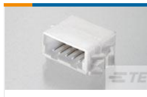
TE 产品编号292254-2 CT RELAY HDR ASSY 2P NAT