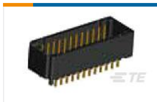
TE 产品编号2-292141-0 CT DOUBLE ROW ASSY V 20P W/BOS