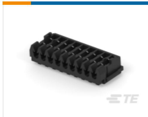
TE 产品编号2-353293-9 1.5MM CT MT REC ASSY 9P BLACK