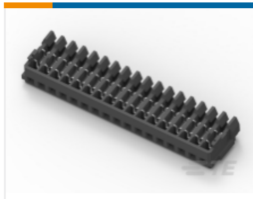
TE 产品编号3-353293-7 1.5MM CT MT REC ASSY 17P BLACK