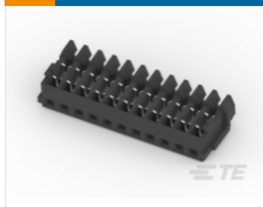
TE 产品编号3-353293-1 1.5MM CT MT REC ASSY 11P BLACK