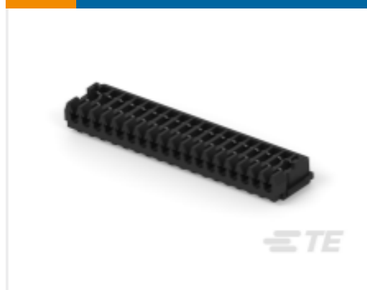
TE 产品编号3-353293-8 1.5MM CT MT REC ASSY 18P BLACK