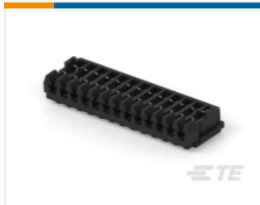
TE 产品编号3-353293-3 1.5MM CT MT REC ASSY 13P BLACK