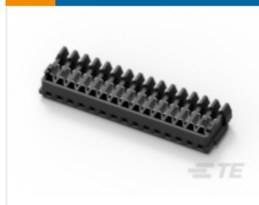
TE 产品编号3-353293-5 1.5MM CT MT REC ASSY 15P BLACK