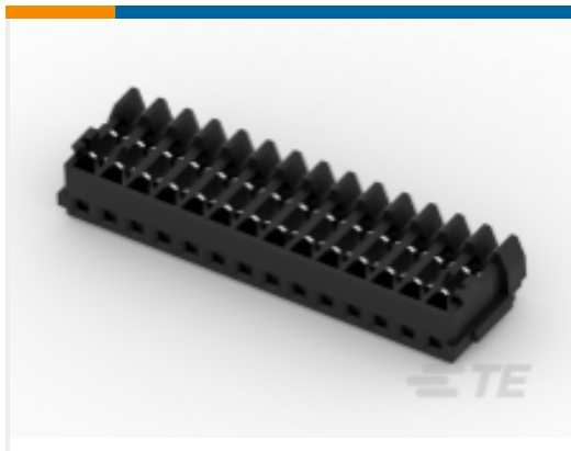
TE 产品编号3-353293-4 1.5MM CT MT REC ASSY 14P BLACK