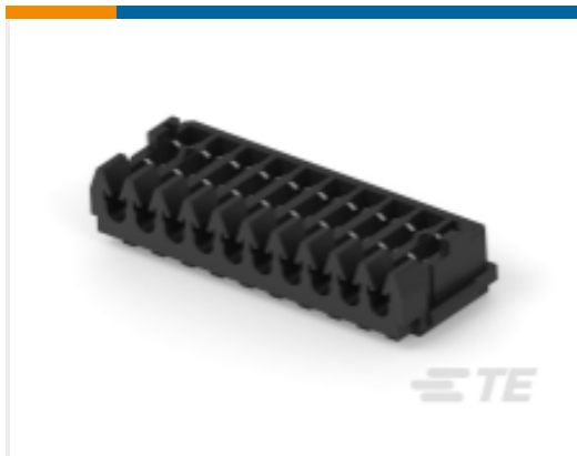
TE 产品编号3-353293-0 1.5MM CT MT REC ASSY 10P BLACK