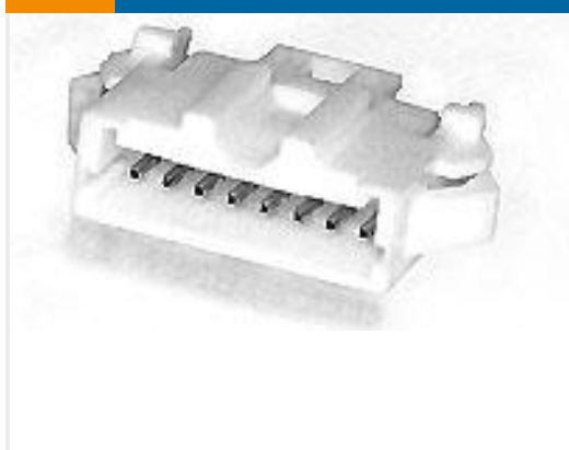
TE 产品编号292215-6 MINI CT SGL RELAY 6P NAT