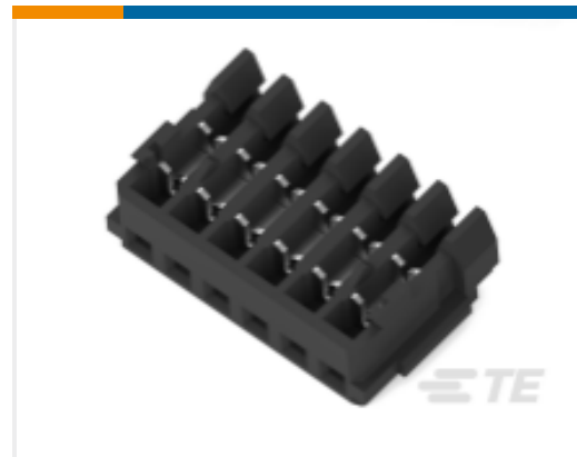
TE 产品编号2-353293-6 1.5MM CT MT REC ASSY 6P BLACK