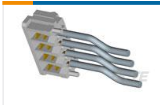
TE 产品编号173977-4 CT CONN MT REC ASSY 4P