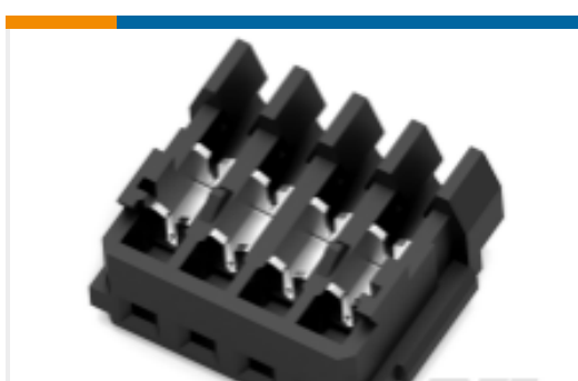
TE 产品编号2-353293-4 1.5MM CT MT REC ASS'Y 4P BLACK