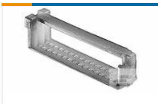
TE 产品编号2-353294-6 AMP MINI D/R HDR HSG 26P NATU