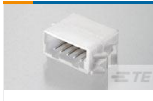
TE 产品编号292254-5 CT RELAY HDR ASSY 5P NAT