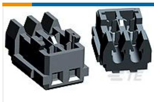
TE 产品编号353293-9 MINI CT MT REC ASSY 9P GRAY