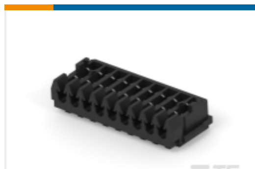
TE 产品编号2-353293-9 1.5MM CT MT REC ASS'Y 9P BLACK