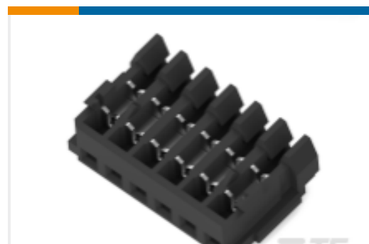
TE 产品编号2-353293-6 1.5MM CT MT REC ASS'Y 6P BLACK