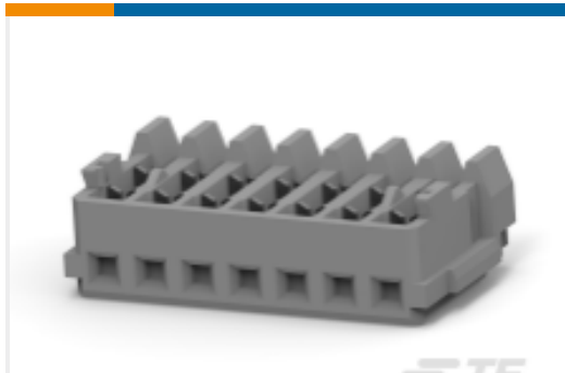
TE 产品编号353908-4 Mini 通用端接 (CT) 连接器