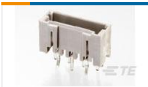
TE 产品编号2-292207-0 MINI CT SGL DIP V 20P NAT