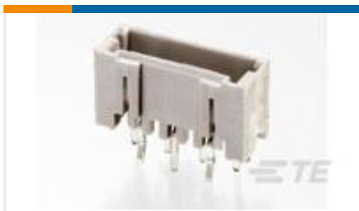
TE 产品编号1-292207-7 MINI CT SGL DIP V 17P NAT