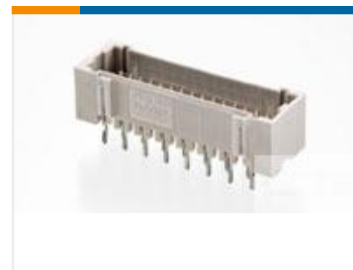
TE 产品编号 2-292208-4 MINI CT D/R DIP 24P V NAT