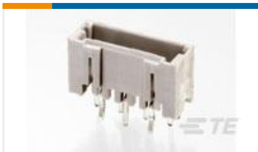
TE 产品编号1-292207-6 MINI CT SGL DIP V 16P NAT