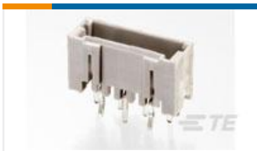
TE 产品编号1-292207-5 MINI CT SGL DIP V 15P NAT