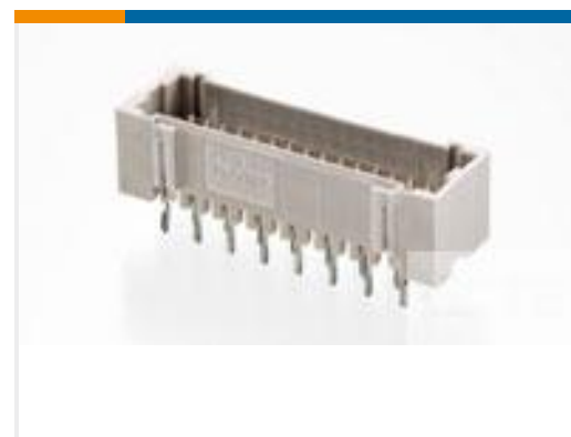
TE 产品编号 2-292208-8 MINI CT D/R DIP 28P V NAT