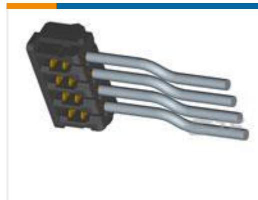
TE 产品编号 3-179694-0 2MM CT MT REC ASSY 10P GRAY