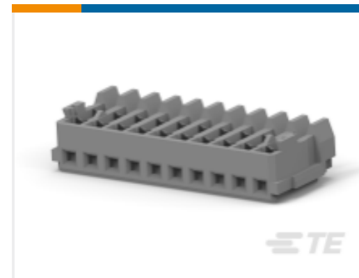
TE 产品编号 1-353293-0 MINI CT MT REC ASSY 10P GRAY