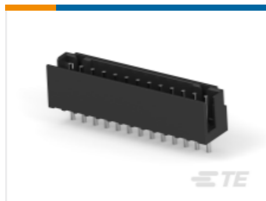
TE 产品编号 1-292132-3 CT 2mm 柱接头组件: Box V DIP