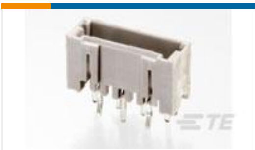
TE 产品编号1-292207-8 MINI CT SGL DIP V 18P NAT