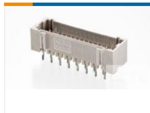
TE 产品编号 3-292208-4 MINI CT D/R DIP 34P V NAT