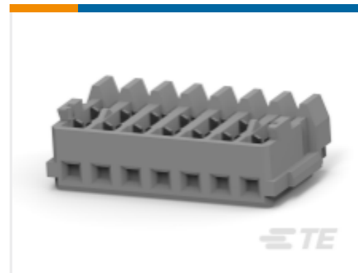
TE 产品编号 CAT-AM7053-H8172 Mini 通用端接 (CT) 连接器