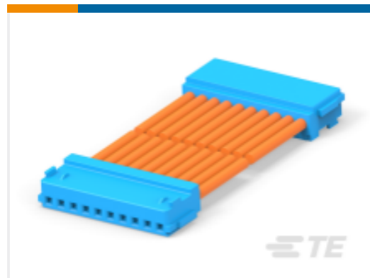
TE 产品编号 2405870-2 CT 10P 300MM CABLE ASSEMBLY 7-353908-0