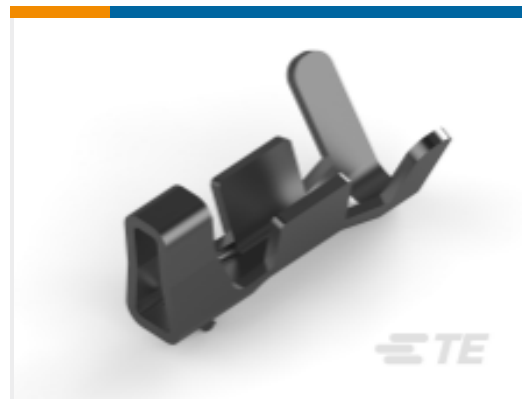
TE 产品编号 CAT-AM7053-C7671 Mini Common Termination Contacts