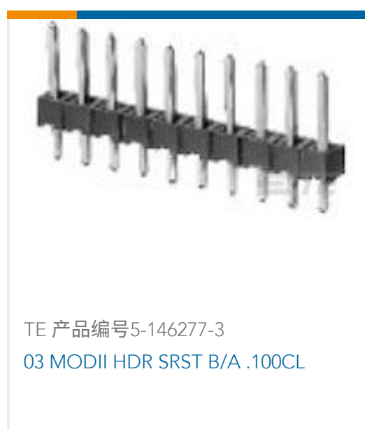
TE 产品编号5-146277-3 03 MODII HDR SRST B/A .100CL