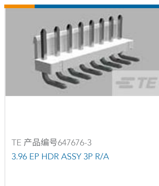
TE 产品编号647676-3 3.96 EP HDR ASSY 3P R/A