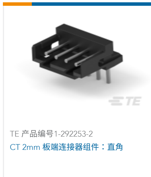
TE 产品编号1-292253-2 CT 2mm 板端连接器组件：直角