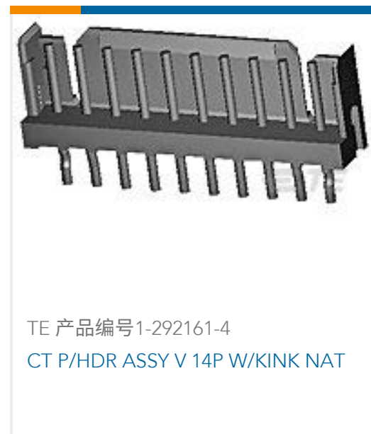
TE 产品编号1-292161-4 CT P/HDR ASSY V 14P W/KINK NAT