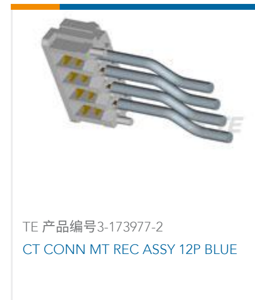
TE 产品编号3-173977-2 CT CONN MT REC ASSY 12P BLUE