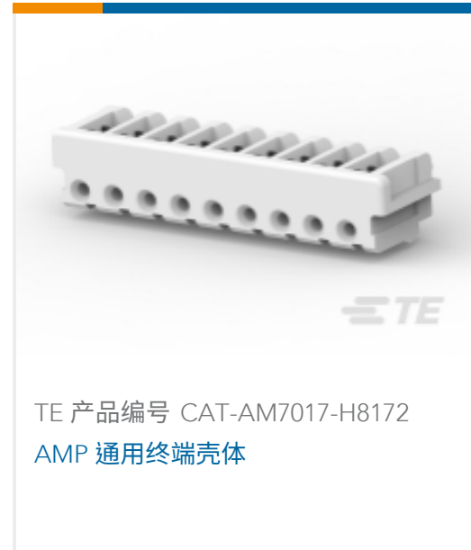
TE 产品编号 CAT-AM7017-H8172 AMP 通用终端壳体