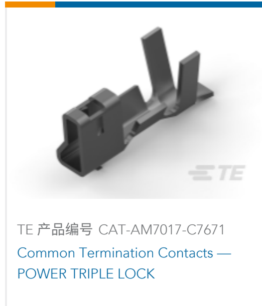
TE 产品编号 CAT-AM7017-C7671 Common Termination Contacts — POWER TRIPLE LOCK