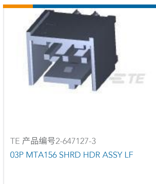
TE 产品编号2-647127-3 03P MTA156 SHRD HDR ASSY LF