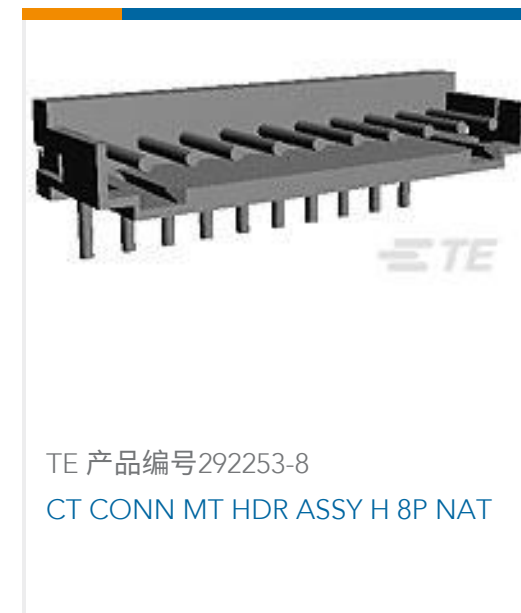
TE 产品编号292253-8 CT CONN MT HDR ASSY H 8P NAT