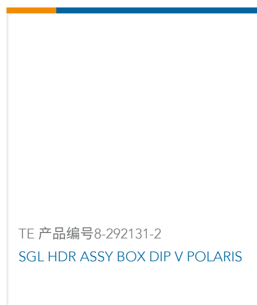
TE 产品编号8-292131-2 SGL HDR ASSY BOX DIP V POLARIS