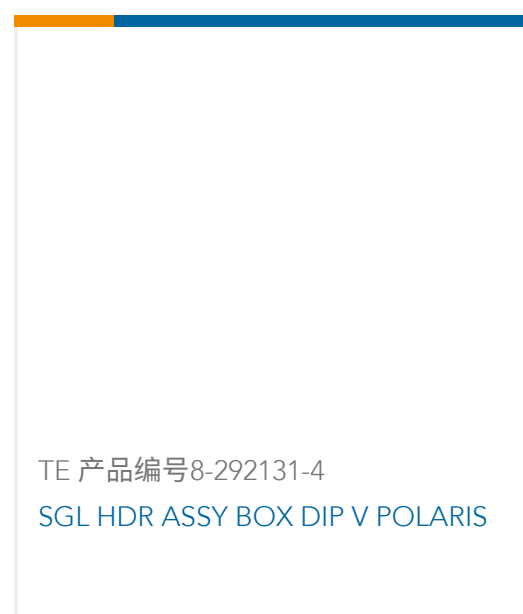
TE 产品编号8-292131-4 SGL HDR ASSY BOX DIP V POLARIS