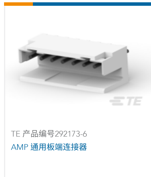
TE 产品编号292173-6 AMP 通用板端连接器