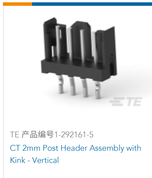
TE 产品编号1-292161-5 CT 2mm Post Header Assembly with Kink - Vertical