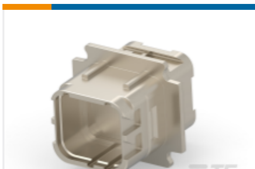
TE 产品编号ZPF00000000146309 Rectangular Connector Receptacle Extenders, Tool-less Assembly