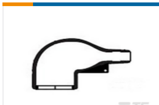
TE 产品编号EF9981-000 222K121-25L/225-0