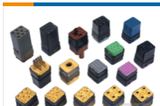
TE 产品编号ZPF00000000148762 DMC-M 99-04 AN (=33537-P0000)