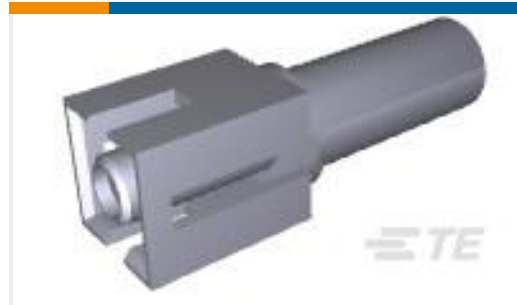
TE 产品编号926472-3 1P UNIV MNL BU GEH