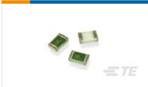
TE 产品编号1676639-2 RN 0805 10R 0.1% 10PPM 1K RL