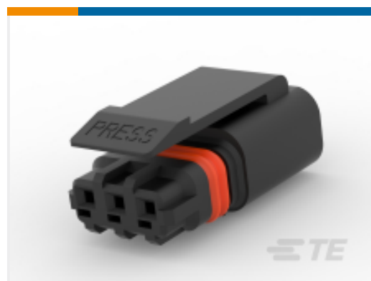
TE 产品编号2-2834074-3 3P PLUG, MINIATURE WATERPROOF CONN,BLACK