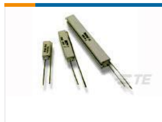
TE 产品编号1623729-1 BCHE 17 W 100R 5%