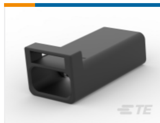
TE 产品编号1-2834075-3 SlimSeal Miniature Receptacles