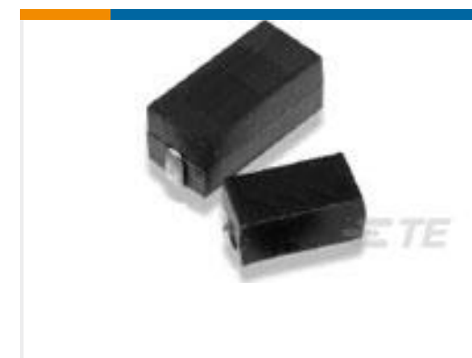
TE 产品编号3-1879021-5 SMW3 2R7 5%