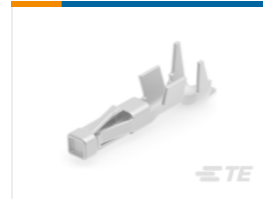
TE 产品编号 2-2834067-2 SOCKET CONTACT,MINIATURE WATERPROOF CONN