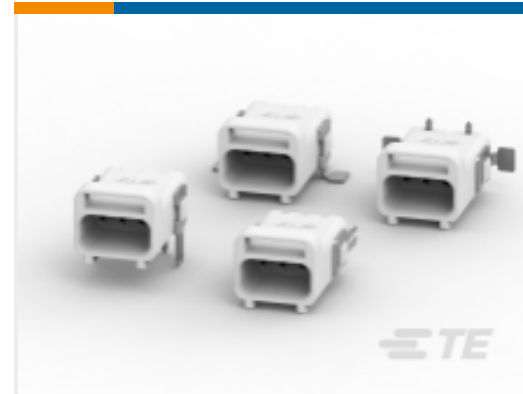
TE 产品编号 CAT-SL36-M6642B Miniature Headers, SlimSeal