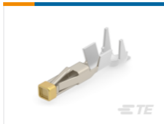
TE 产品编号 2-2834067-3 SOCKET CONTACT,MINIATURE WATERPROOF CONN