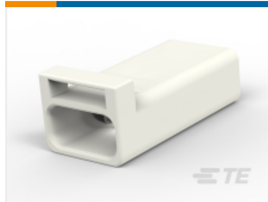
TE 产品编号 1-2834075-2 2P REC, MINIATURE WATERPROOF CONN.WHITE