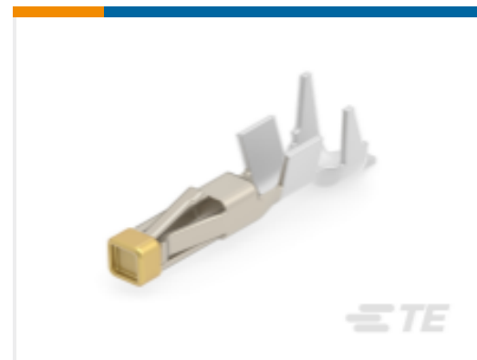
TE 产品编号 1-2834067-3 SOCKET CONTACT,MINIATURE WATERPROOF CONN