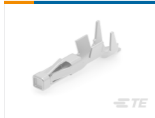
TE 产品编号 1-2834067-2 SOCKET CONTACT,MINIATURE WATERPROOF CONN