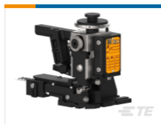
TE 产品编号 2836413-1 OCEAN_2.0_APPLICATOR-S- 055F0800