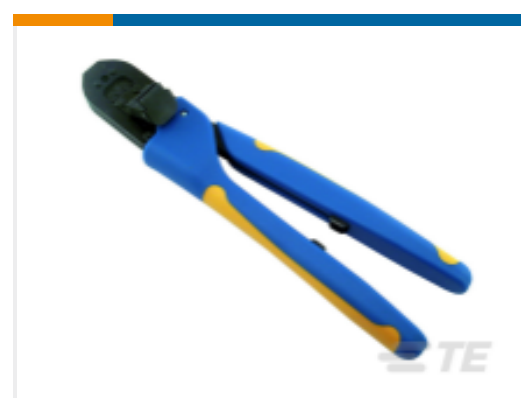
TE 产品编号 2305567-1 CCII MINIATURE TAB SOCKET 22-18 ASSY