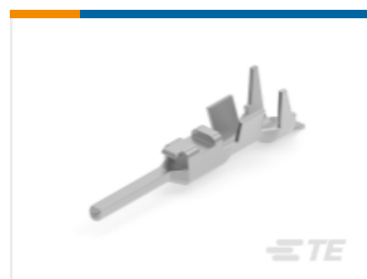
TE 产品编号 1-2834068-2 PIN CONTACT, MINIATURE WATERPROOF CONN