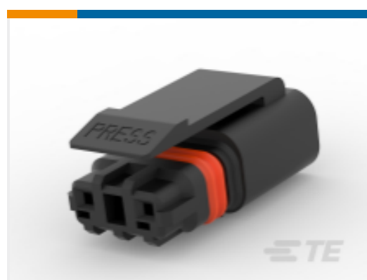
TE 产品编号 CAT-SL36-M6642 SlimSeal Miniature Plugs