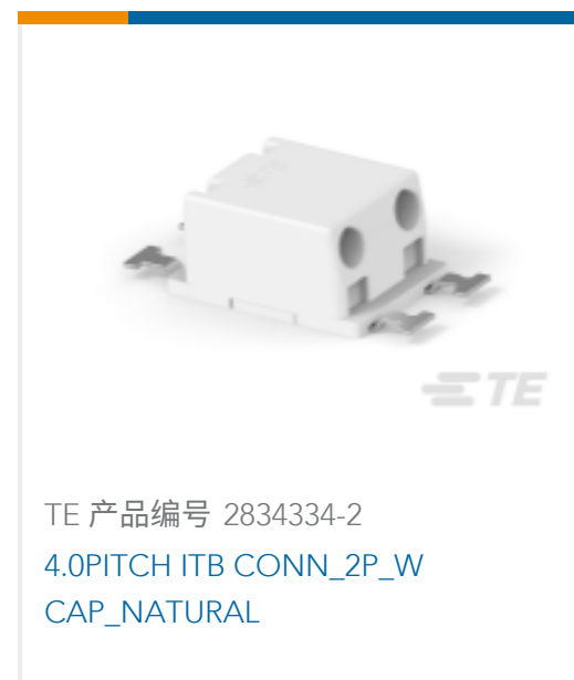
TE 产品编号 2834334-2 4.0PITCH ITB CONN_2P_W CAP_NATURAL