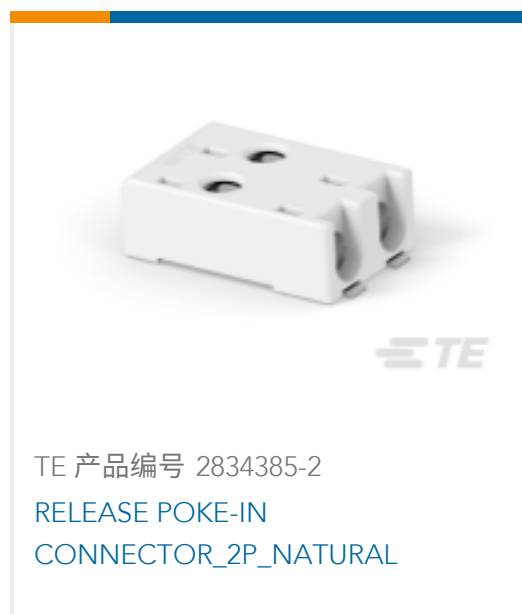
TE 产品编号 2834385-2 RELEASE POKE-IN CONNECTOR_2P_NATURAL