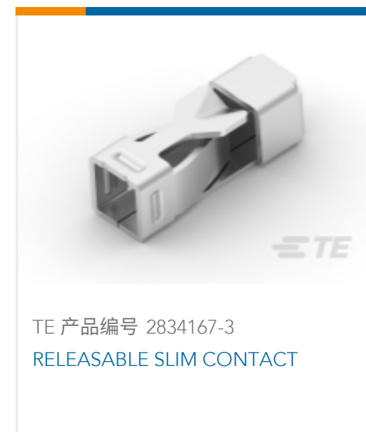
TE 产品编号 2834167-3 RELEASABLE SLIM CONTACT