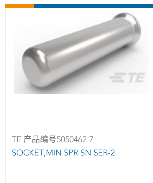
TE 产品编号5050462-7 SOCKET,MIN SPR SN SER-2