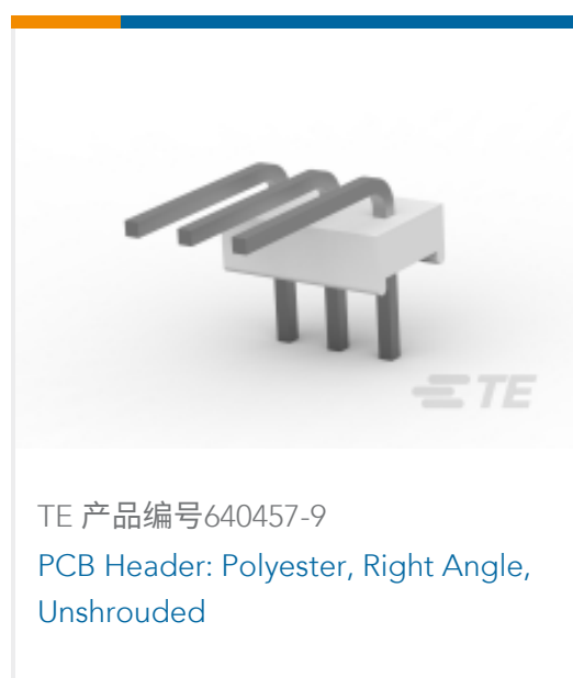
TE 产品编号640457-9 PCB Header: Polyester, Right Angle, Unshrouded