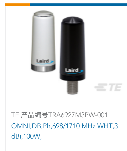
TE 产品编号TRA6927M3PW-001 OMNI,DB,Ph,698/1710 MHz WHT,3 dBi,100W,