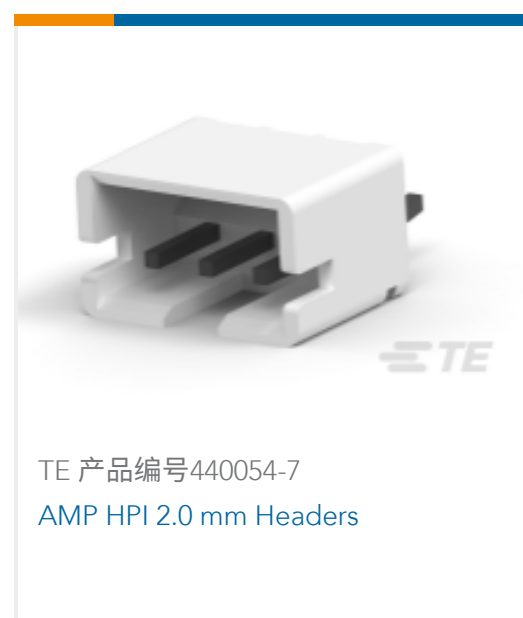
TE 产品编号440054-7 AMP HPI 2.0 mm Headers