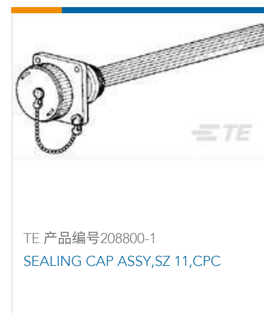
TE 产品编号208800-1 SEALING CAP ASSY,SZ 11,CPC