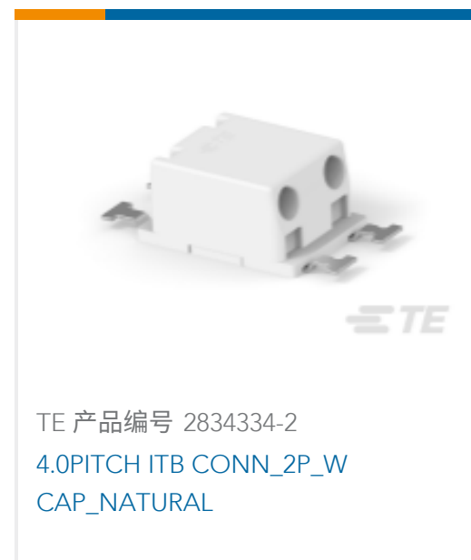
TE 产品编号 2834334-2 4.0PITCH ITB CONN_2P_W CAP_NATURAL