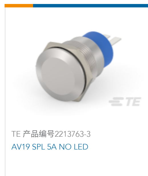
TE 产品编号2213763-3 AV19 SPL 5A NO LED