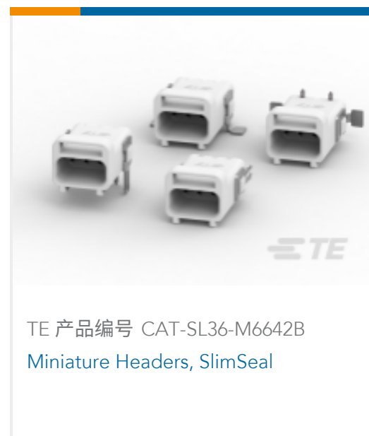
TE 产品编号 CAT-SL36-M6642B Miniature Headers, SlimSeal