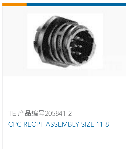
TE 产品编号205841-2 CPC RECEPT ASSEMBLY SIZE 11-8