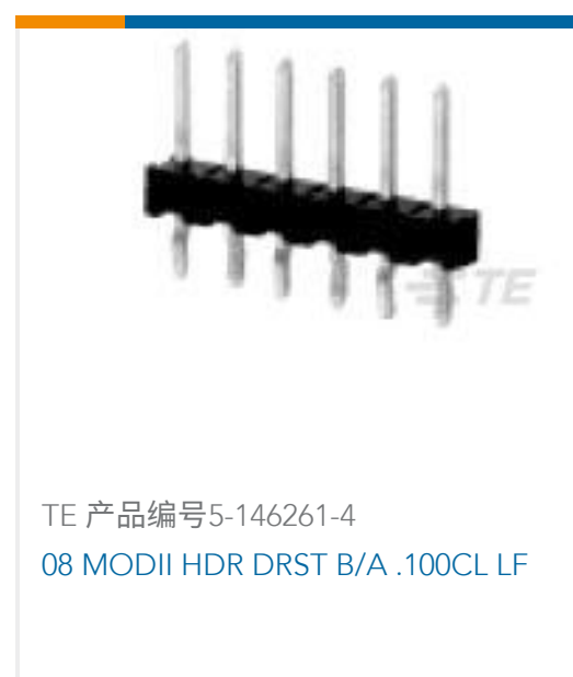
TE 产品编号5-146261-4 08 MODIII HDR DRST B/A .100CL LF