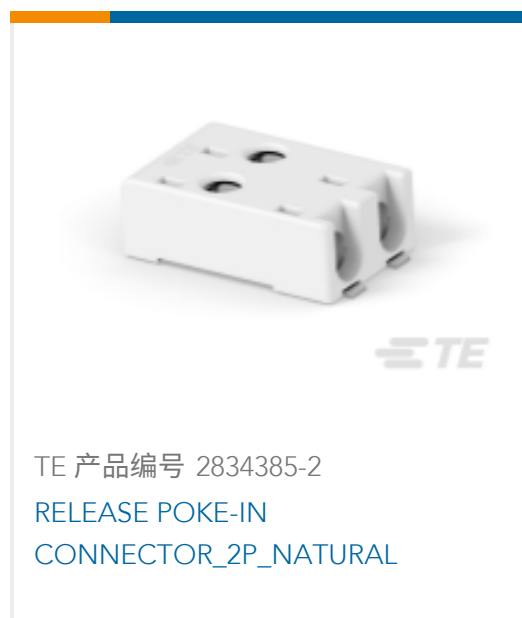
TE 产品编号 2834385-2 RELEASE POKE-IN CONNECTOR_2P_NATURAL