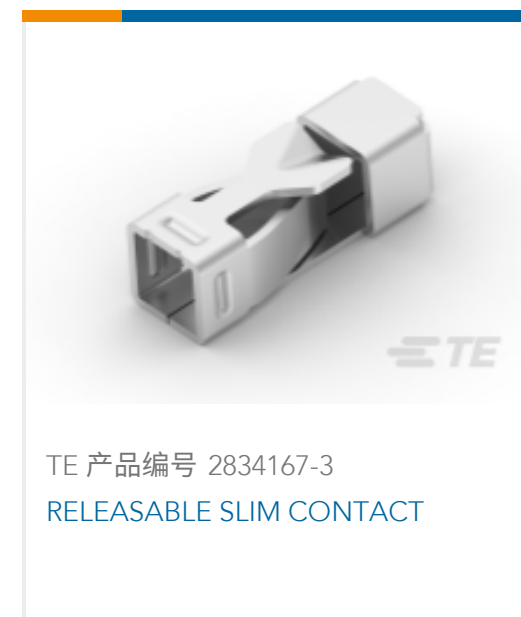
TE 产品编号 2834167-3 RELEASABLE SLIM CONTACT