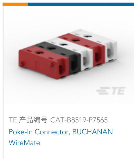
TE 产品编号 CAT-B8519-P7565 Poke-In Connector, BUCHANAN WireMate