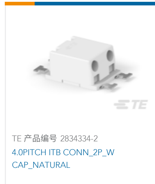
TE 产品编号 2834334-2 4.0PITCH ITB CONN_2P_W CAP_NATURAL