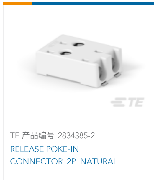
TE 产品编号 2834385-2 RELEASE POKE-IN CONNECTOR_2P_NATURAL