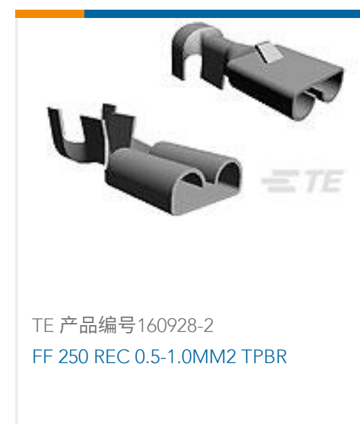
TE 产品编号160928-2 FF 250 REC 0.5-1.0MM2 TPBR