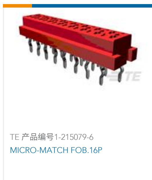
TE 产品编号1-215079-6 MICRO-MATCH FOB.16P