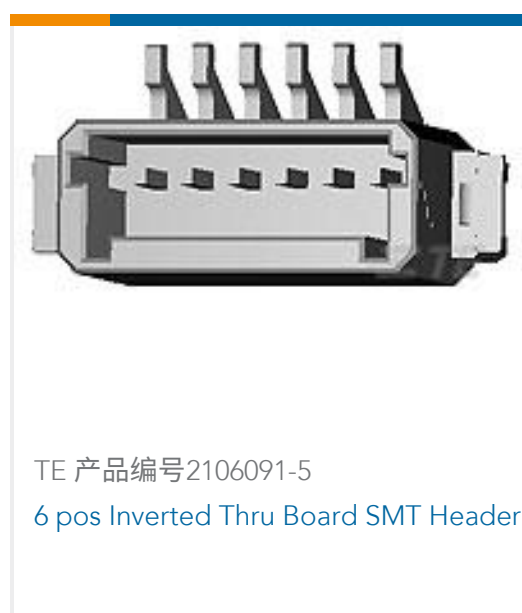
TE 产品编号2106091-5 6 pos Inverted Thru Board SMT Header