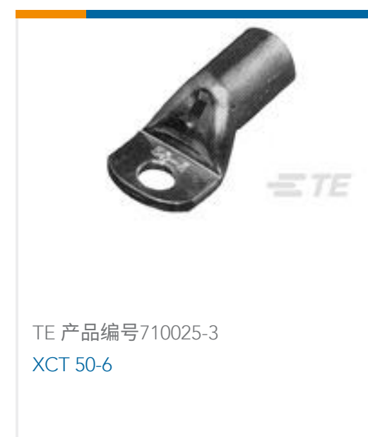
TE 产品编号710025-3 XCT 50-6