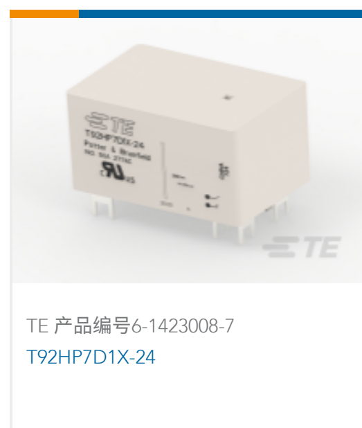
TE 产品编号6-1423008-7 T92HP7D1X-24