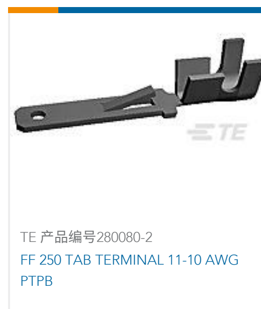
TE 产品编号280080-2 FF 250 TAB TERMINAL 11-10 AWG PTPB