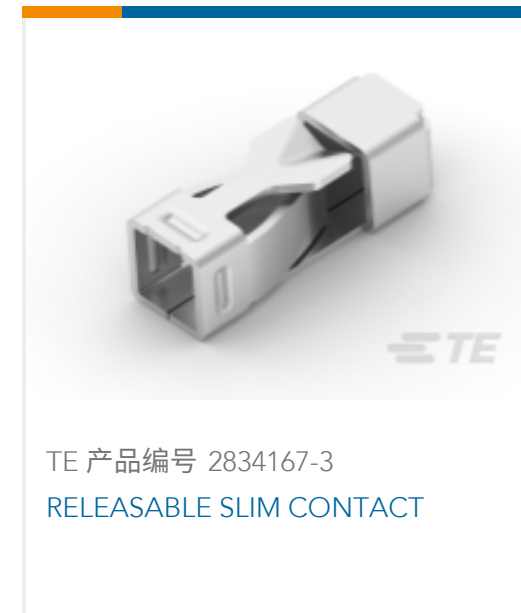
TE 产品编号 2834167-3 RELEASABLE SLIM CONTACT