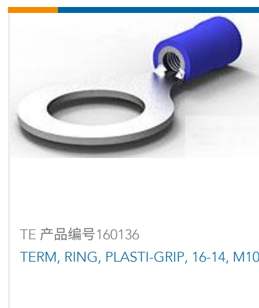
TE 产品编号160136 TERM, RING, PLASTI-GRIP, 16-14, M10