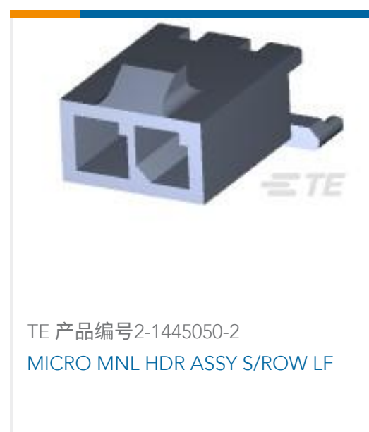
TE 产品编号2-1445050-2 MICRO MNL HDR ASSY S/ROW LF