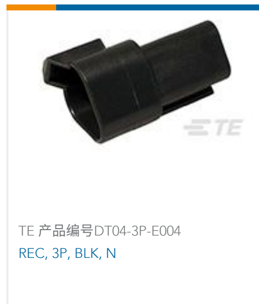
TE 产品编号DT04-3P-E004 REC, 3P, BLK, N