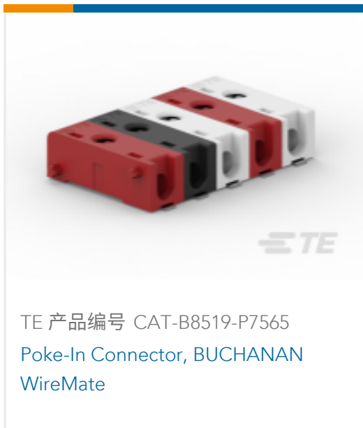
TE 产品编号 CAT-B8519-P7565 Poke-In Connector, BUCHANAN WireMate