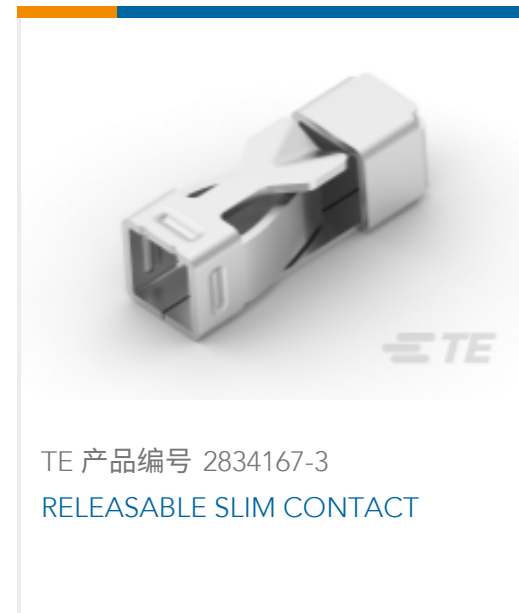
TE 产品编号 2834167-3 RELEASABLE SLIM CONTACT