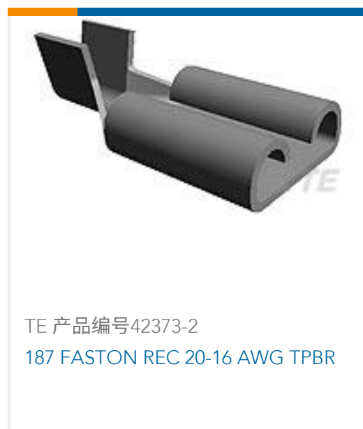
TE 产品编号42373-2 187 FASTON REC 20-16 AWG TPBR