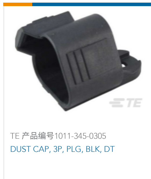
TE 产品编号1011-345-0305 DUST CAP, 3P, PLG, BLK, DT