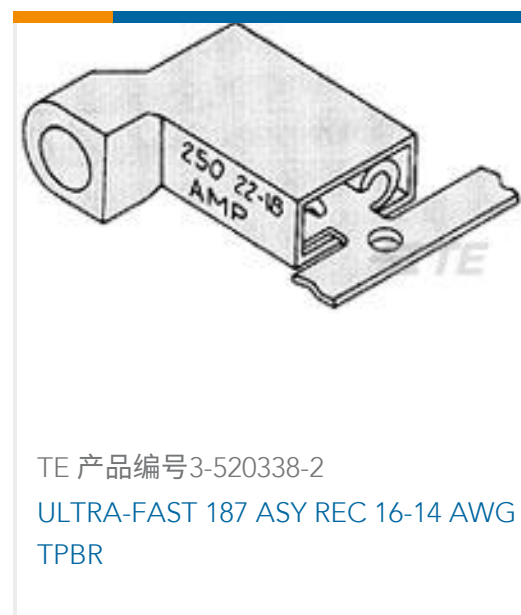
TE 产品编号3-520338-2 ULTRA-FAST 187 ASY REC 16-14 AWG TPBR