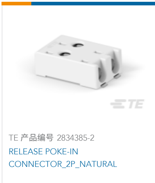
TE 产品编号 2834385-2 RELEASE POKE-IN CONNECTOR_2P_NATURAL