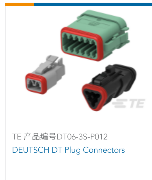
TE 产品编号DT06-3S-P012 DEUTSCH DT Plug Connectors