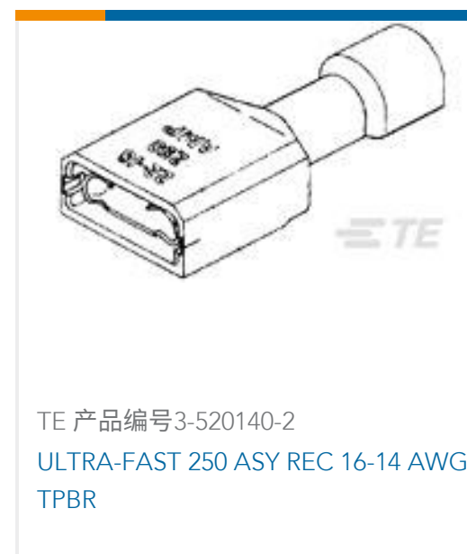
TE 产品编号3-520140-2 ULTRA-FAST 250 ASY REC 16-14 AWG TPBR