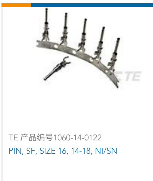
TE 产品编号1060-14-0122 PIN, SF, SIZE 16, 14-18, NI/SN