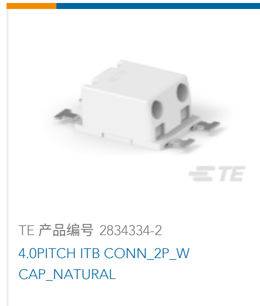
TE 产品编号 2834334-2 4.0PITCH ITB CONN_2P_W CAP_NATURAL