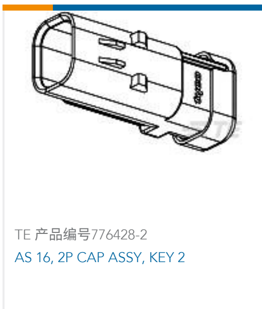
TE 产品编号776428-2 AS 16, 2P CAP ASSY, KEY 2