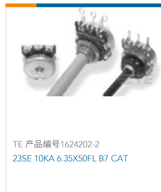
TE 产品编号1624202-2 23SE 10KA 6.35X50FL B7 CAT