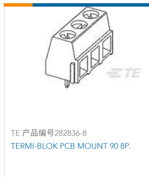
TE 产品编号282836-8 TERMI-BLOK PCB MOUNT 90 8P.