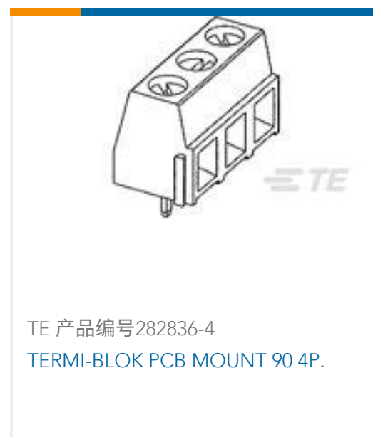
TE 产品编号282836-4 TERMI-BLOK PCB MOUNT 90 4P.