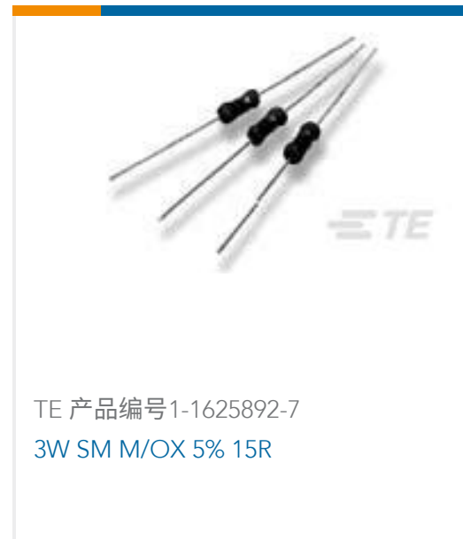
TE 产品编号1-1625892-7 3W SM M/OX 5% 15R