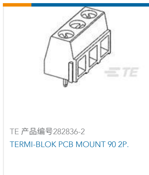
TE 产品编号282836-2 TERMI-BLOK PCB MOUNT 90 2P.