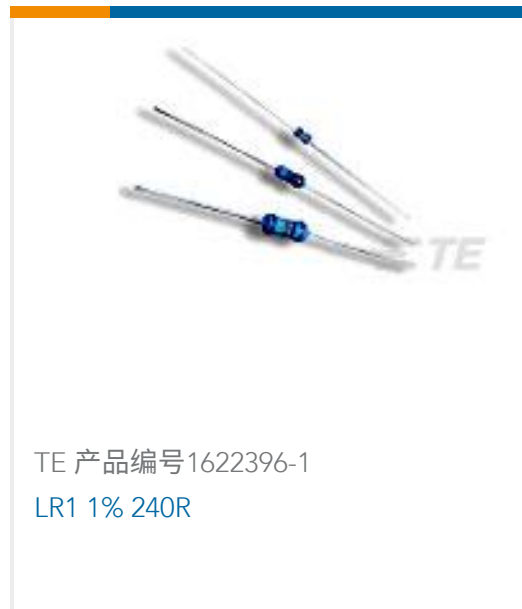
TE 产品编号1622396-1 LR1 1% 240R